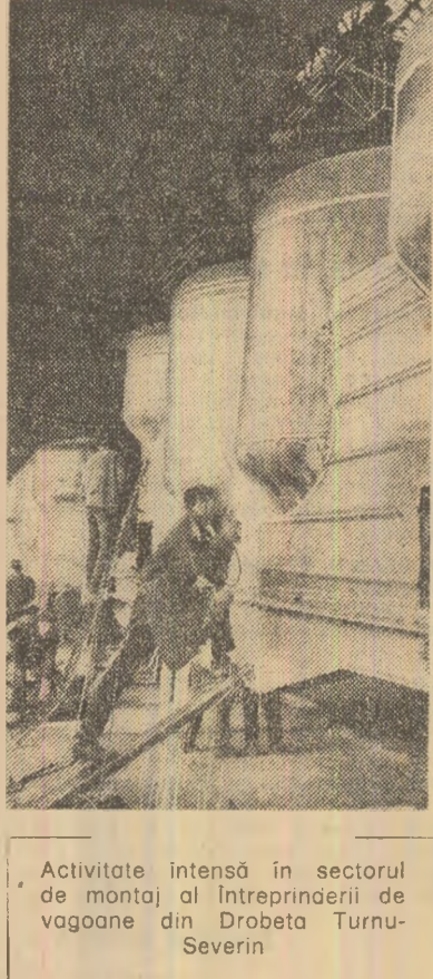
Activitate intensă în sectorul de montaj al întreprinderii de vagoane din Drobeta Turnu-Severin