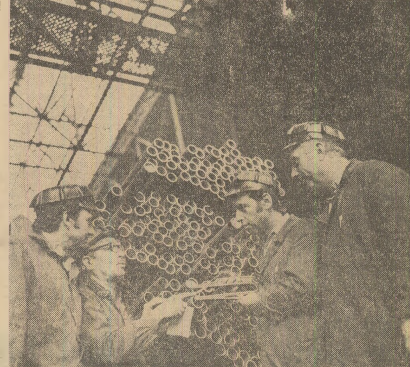
„Sarcinile la export îndeplinite exemplar” — este deviza colectivului întreprinderii de țevi „Republica” din Capitală. În fotografie: se controlează cu exigență un nou lot de produse metalurgice care urmează a fi expediat unor parteneri de peste hotare

Oamenii muncii din întreprinderile industriei ușoare au realizat, în primul trimestru, o producție suplimentară în valoare de peste 500 milioane lei. Față de aceeași perioadă a anului trecut, volumul bunurilor fabricate este superior cu aproape 10 la sută. De remarcă că cea mai mare parte din sporul de producție s-a obținut pe seama creșterii productivității muncii. Aplicarea de noi tehnologii a permis, încă din primele luni ale anului, introducerea în fabricație a unor noi sortimente, lărgirea și diversificarea producției. (Agerpres).