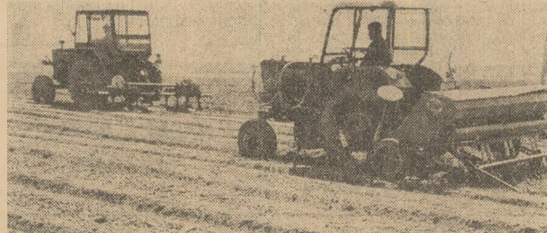
La cooperativa agricolă Călinești, județul Argeș, duminică s-au semănat ultimele hectare cu morcovii.

În ultimele zile s-a lucrat în ritm mai intens pe ogoare. Ca rezultat al acțiunilor întreprinse de organizațiile de partid, comandamentele comunale și conducerea de unități agricole comandamentele judecătorești a muncii mecanizatorilor și cooperatorilor, suprafețele însămânțate au crescut simțitor. Din datele centralizate în cursul zilei de ieri la ministerul de resort rezultă că până la 5 aprilie au fost însămânțate peste 705 000 hectare — jumătate din suprafețele destinate culturilor din prima epocă.