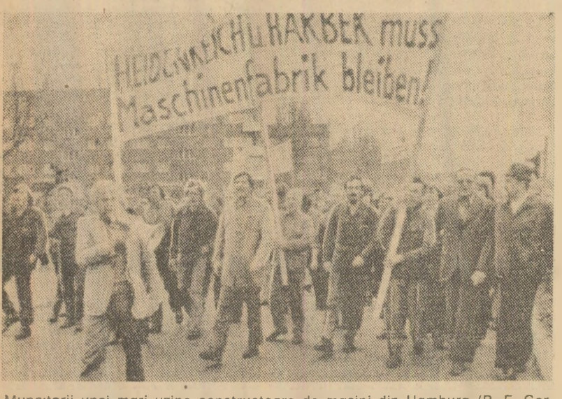
Muncitorii unei mari uzine constructoare de mașini din Hamburg (R. F. Germania) demonstrează împotriva intenției patronatului de a închide întreprinderea și de a concedia pe salarii. Circa 1 100 de muncitori sînt amenințați să-și părăsească locurile de muncă

Reprezentantul român a menționat sesiunea Comitetului interguvernamental pentru elaborarea Constituției O.N.U.D.I., a cărei lucrări s-au desfășurat între 22 martie și 3 aprilie, marcând, prin contribuția staterilor membre și înainte de toate a „Grupului celor 77”, din care face parte și țara noastră, încă un pas în direcția stabilirii cadrului politico-juridic al