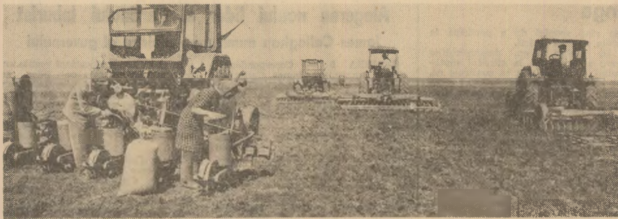
Ferma Călugăreni a I.A.S. Cornăești este prima unitate din județul Dimbovița care a început semănatul florizoarelor