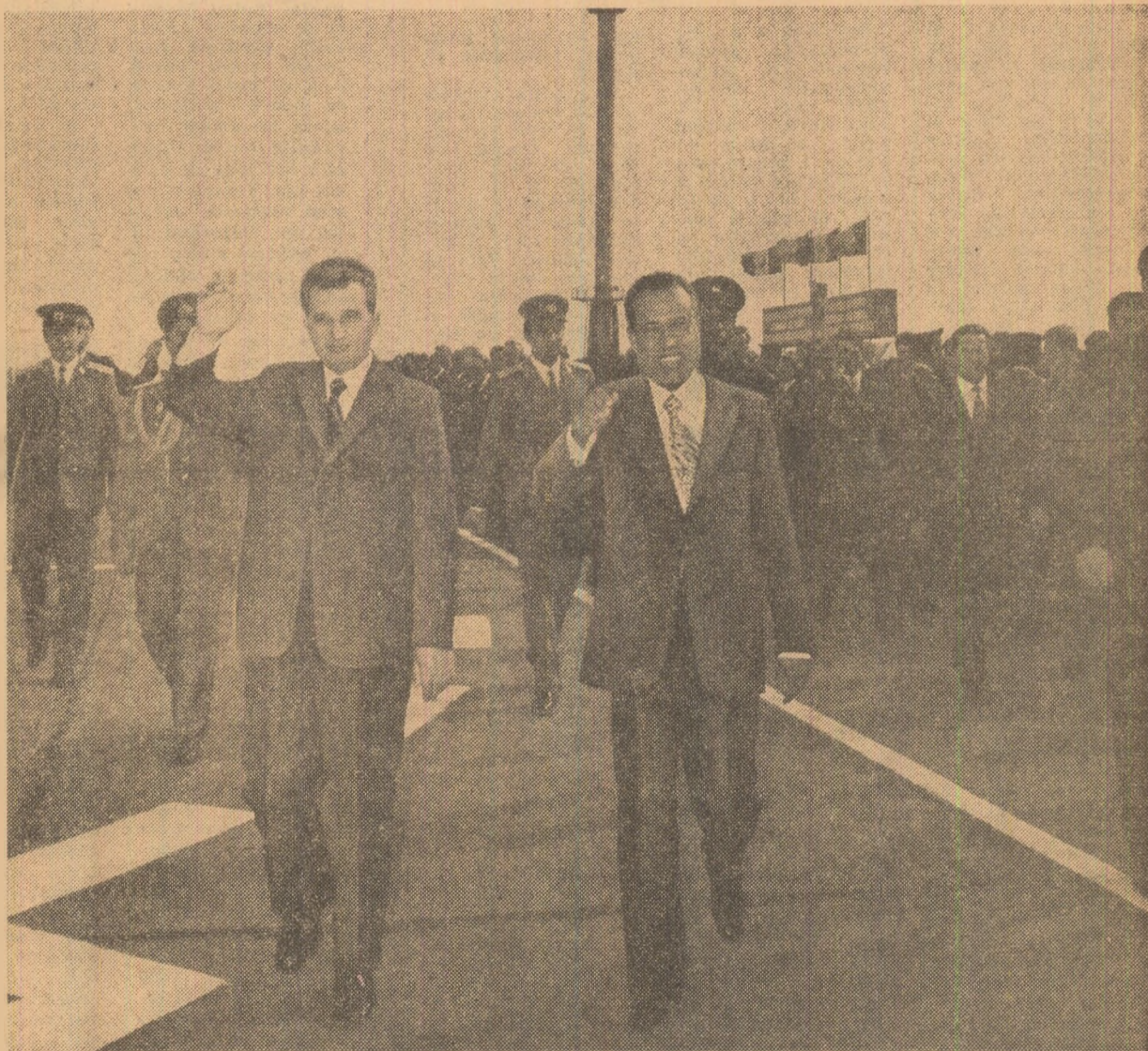
La sosirea pe aeroportul Otopeni

procă, caracteristică relațiilor între s-au statornicit și se dezvoltă între partidele și țările noastre, potrivit intereselor și aspirațiilor ambelor popoare, în folosul cauzei păcii, cooperării și progresului în lume.