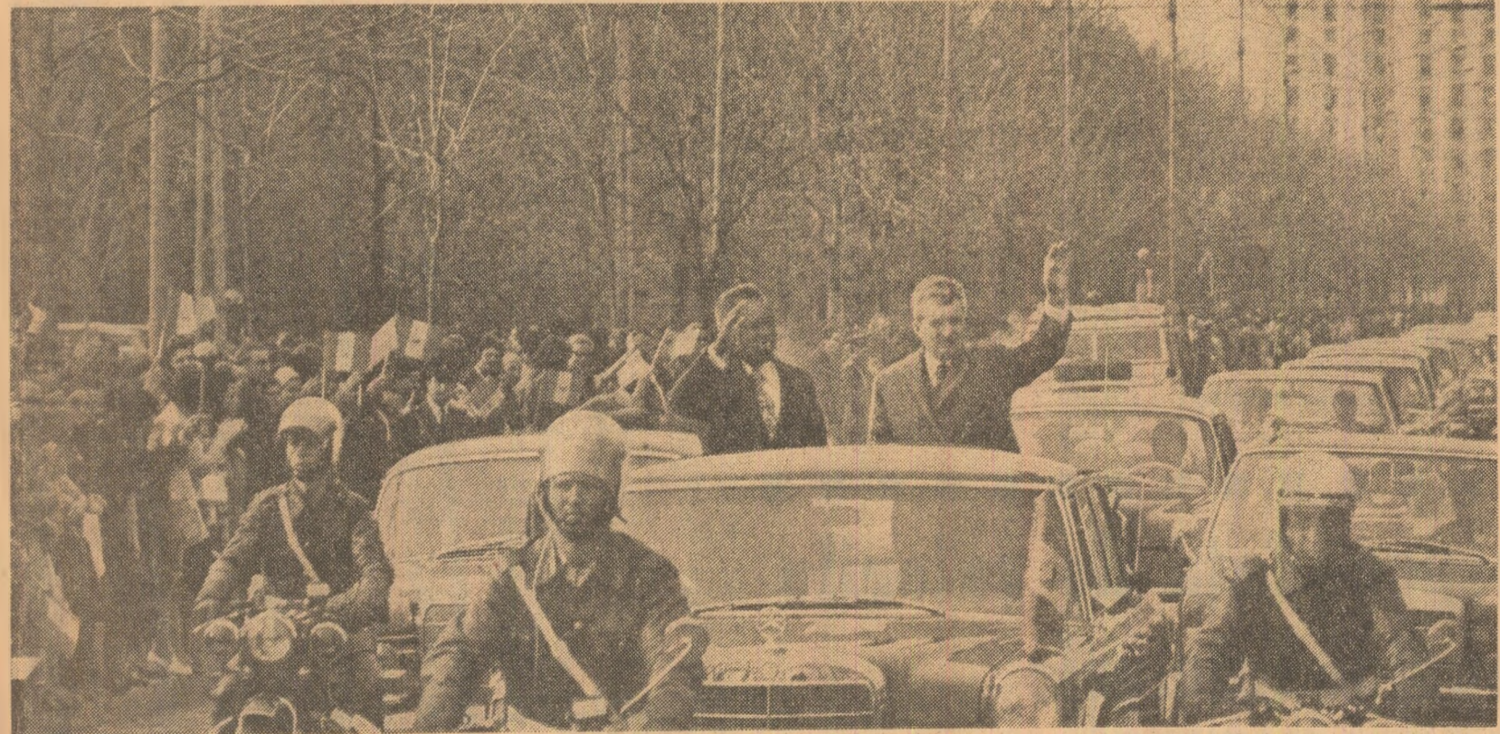
Pe traseu, ovaiții și aplauze, călduroase manifestări de stimă din partea a mii și mii de locuitori ai Capitalei

Aceste sentimente de profundă stimă față de cei doi președinți le rezăsim exprimate direct și cald de mii de locuitori ai Capitalei veniți în întâmpinarea de-a lungul traseului. Din mașina deschisă, cei doi președinți răspund cu cordialitate aplauzelor îndelungi și semnelor de prietenie ale mulțimii. Aceste manifestări alt de semnificative pentru binele relații existente între țările și popoarele noastre însoțesc pe președinții Nicolae Ceaușescu și Luis Cabral până la reședința rezervată înaltului oaspete. (Agerpres)