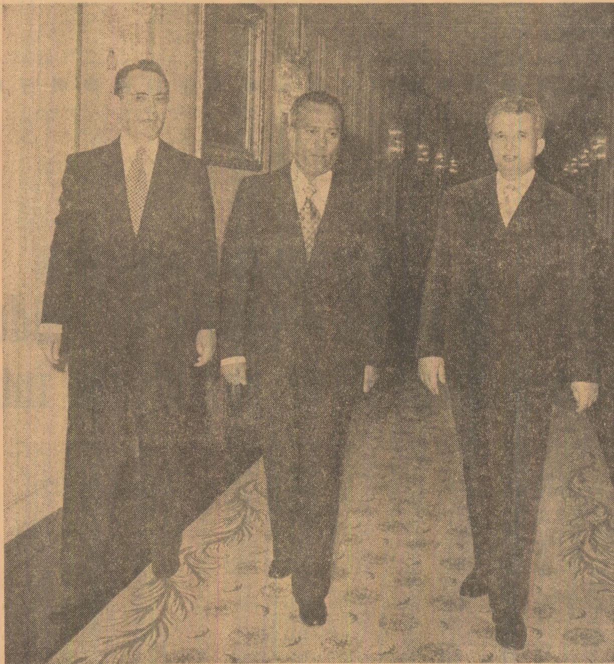
La dineul oficial

La încheierea toasturilor au fost intonate imnurile de stat ale celor două țări.