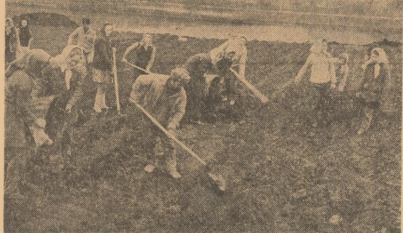
La I.A.S. Tirgu-Frumos, judeţul Iaşi, se lucrează intens la plantarea cartofilor.

Şi în alte cooperative agricole, cum sînt cele din consiliile intercooperatiste TG Buior, Hanu Conachi, Băleni, Ivesti, Şerbăneşti, Tudor Vladimirescu — mecanizatorii, cooperatorii şi specialiştii acordă o atenţie deosebită efectuării unor lucrări de bună calitate la pregătirea terenului şi semănat. În raionul nostru am găsit şi unele aspecte pe care le aducem la cunoştinţa organelor agricole judeţene. Bunăoară, în curtea secţiei de mecanizare, cum sînt cele două secţii care servesc cooperative agricole Pechea, şi la Costache Negri, se aflau un mare număr de tractoare. De ce nu erau în cîmp? Răspunsul a fost acelaşi în toate cazurile: îngruşarea şi uzura stabilizatorilor de lucru pentru toate mijloacele mecanice. De asemenea, la unele secţii de mecanizare, cum sînt cele trei secţii ale S.M.A. Cudabî, Pechea şi Costache Negri, nu s-a organizat în mod corespunzător, deşi au suprafeţe mari care trebuie să fie grăpate sau pregătite pentru semănatul florii-soarelui.