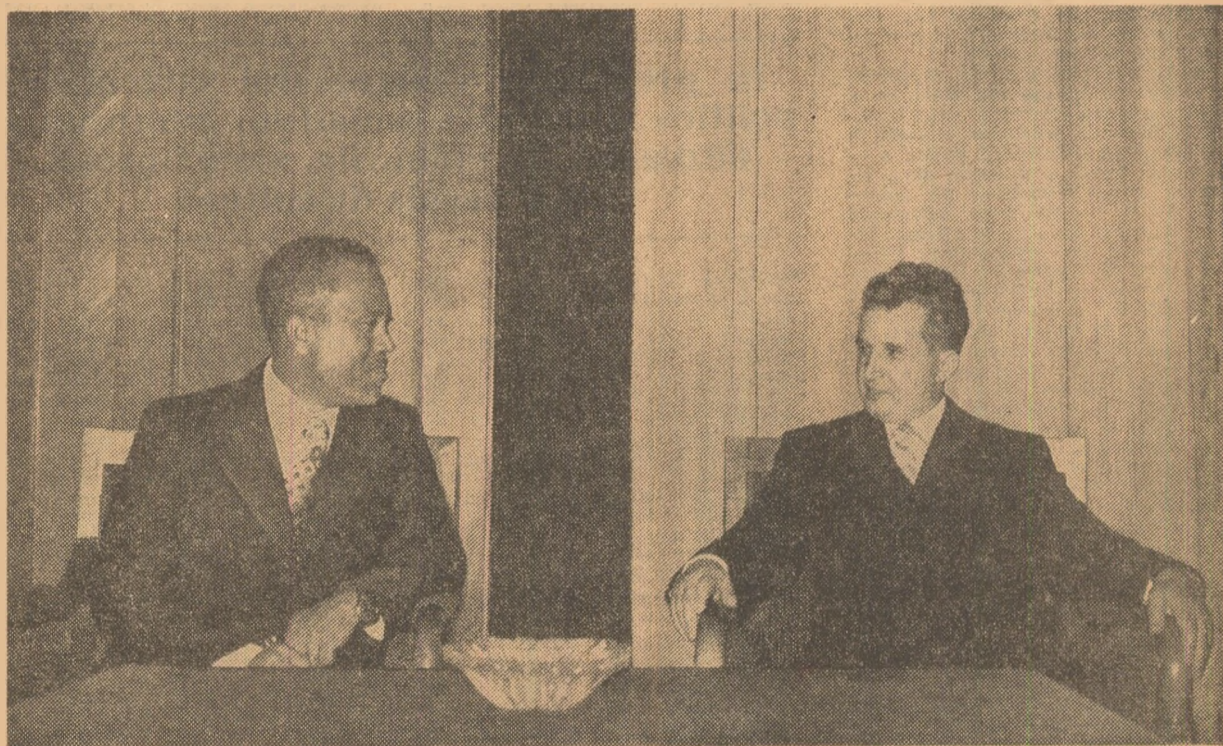
Președintele Consiliului de Stat al Republicii Guinea-Bissau, tovarășul Luis Cabral, a făcut, în cursul serii, o vizită protocolară președintelui Republicii Socialiste România, tovarășul Nicolae Ceaușescu.

A participat tovarășul Manea Mănescu, prim-ministru al guvernului. Această primă intrevvedere dintre cei doi șefi de stat, premergătoare convorbirilor oficiale, s-a desfășurat într-o ambianță de caldă prietenie, de deplină înțelegere și stimă reci-