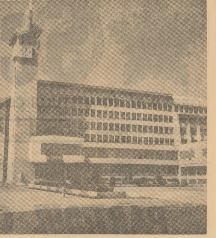
Vaslui — Sediu politic și administrativ al județului