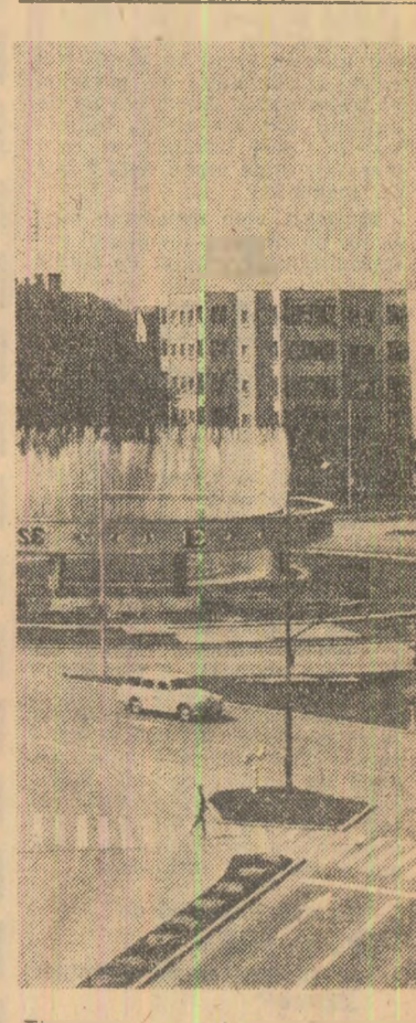
Timișoara — noi realizări edilitare

și orașele fiind pline de joaca și larma copiilor. Griul a izvorit cit vezi cu ochii, pe colini au iesit turmele, pe alcuri, și plugurile trase de mașini, pregătind semănăturile de primăvară, e dezgropată via pe dealuri și în grădini și focurile afumă în amurg liveze. Botoșanii, un sat ditu vechime al marelui Bolăș (butas — vită de vie de un an), după Iorga, devine prin ctitoria lui Ștefan a mănăstirii de la Poștați o cetate ce crește cu veacurile, ajungînd astăzi oraș în continuă dezvoltare, centru de județ, cu trei-prezece școli, un teatru, filarmonică, școli profesionale și cîteva întreprinderi noi în care lucrează mii de oameni. Din ultimul deceniu lucrează din ce în ce mai mulți oameni în industrie. Mecanizarea acestui bloc militar-politic, ce permite menținerea bazelor și trupelor militare străine pe teri-