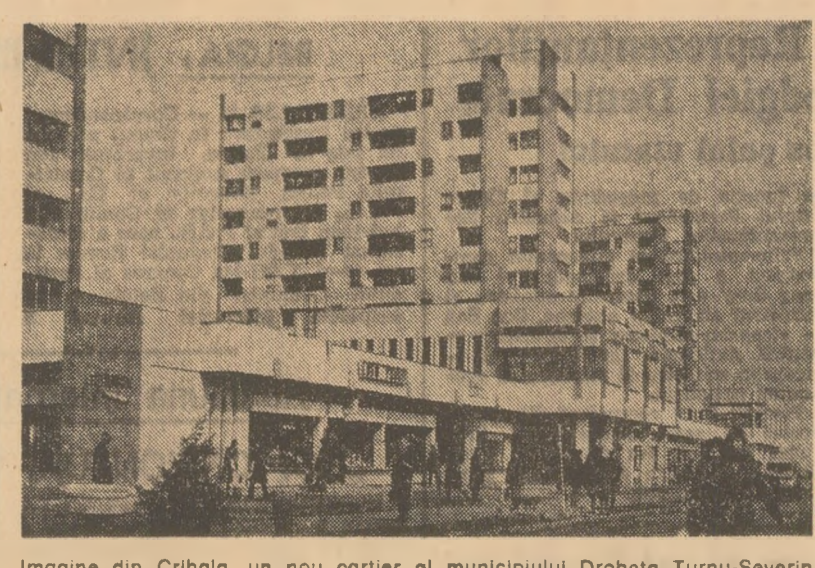
Imagine din Crihana, un nou cartier al municipiului Drobeta Turnu-Severin.

Ieri, la București, s-a desfășurat ultimul meci din cadrul grupei a IV-a (europenean) a preliminariilor olimpice, între echipele României și Olandei. A învins echipa olimpică română pe 5-1 (3-1). Astfel, fotbalistii noștri n-au recuperat nici măcar diferența de golaveraj care o separa de echipa olimpică a Franței (sase goluri) și a ratat calificarea pentru J.O. de la Montreal. SOȚIA 14 (Agerpres). — Miercuri, în Cupa balcanică de fotbal, la Sofia a avut loc meciul dintre echipa locală Akademik și formația Sportul studențesc București. Fotbalistii bulgari au terminat învingători cu scorul de 4-2 (1-0).