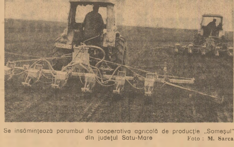
Se înșămîntează porumbul la cooperativa agricolă de producție „Someșul” din județul Satu-Mare.