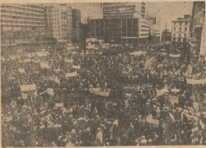
La chemarea Federației Generale a Muncii din Belgia, la Bruxelles a avut loc o amplă demonstrație a oamenilor muncii împotriva șomajului