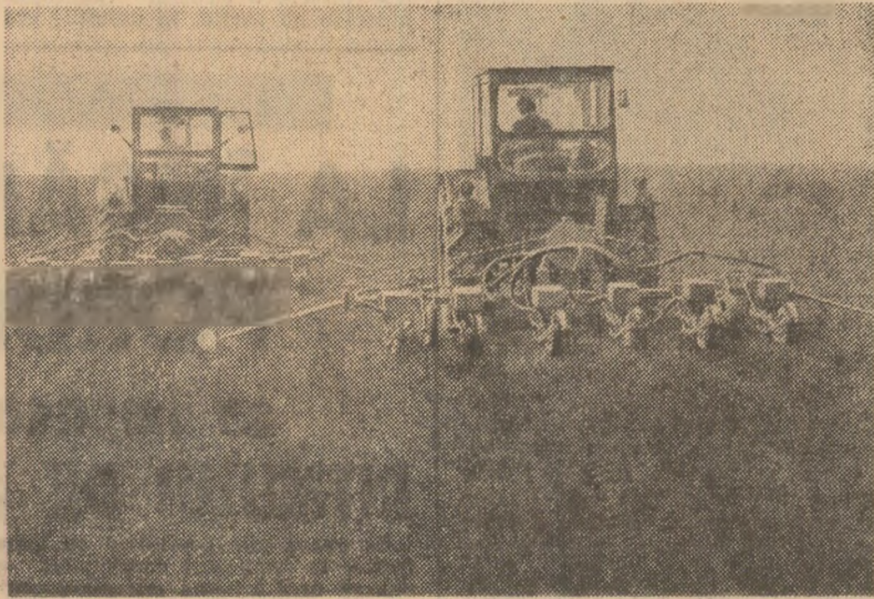
Pe ogoarele cooperativei agricole de producție Conduratu, județul Prohova, la semănatul porumbului