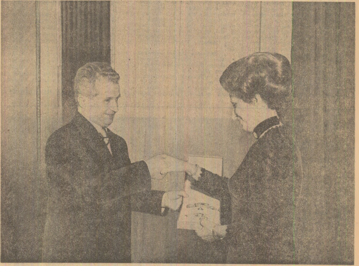
Aspecte din timpul înmînării înaltelor distincții