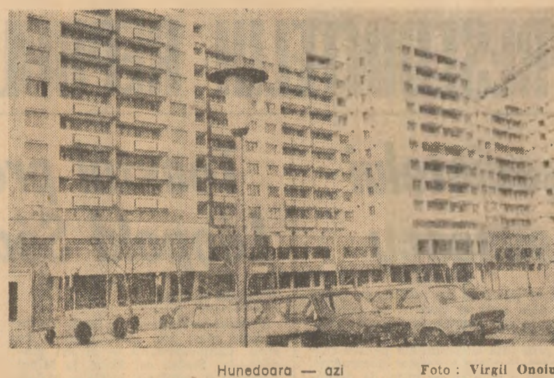
Hunedoara — azi

teoretician pentru care domeniul — și nu străduim — ca fiecare film de actualitate să impună un erou, mai bine zis un om cu care spectatorul să-și dorească să semene. Ștefan, maestrul strungar și vechi activist de partid. Mircea, maestrul sondaș, Silvia Buraga, soția sa. Mișcă Irod, comunistul pentru care jurământul lui Hippocrat este înnobit de crezul său politic. Angela, soferia de taxi care trece prin viață și războie greutăți cu firea ei robustă și optimismul pe care nimic nu-l poate înfringe — iată nume și biografii devenire despre care am fi fericiți să știm că vor lăsa urme în conștiința publicului.