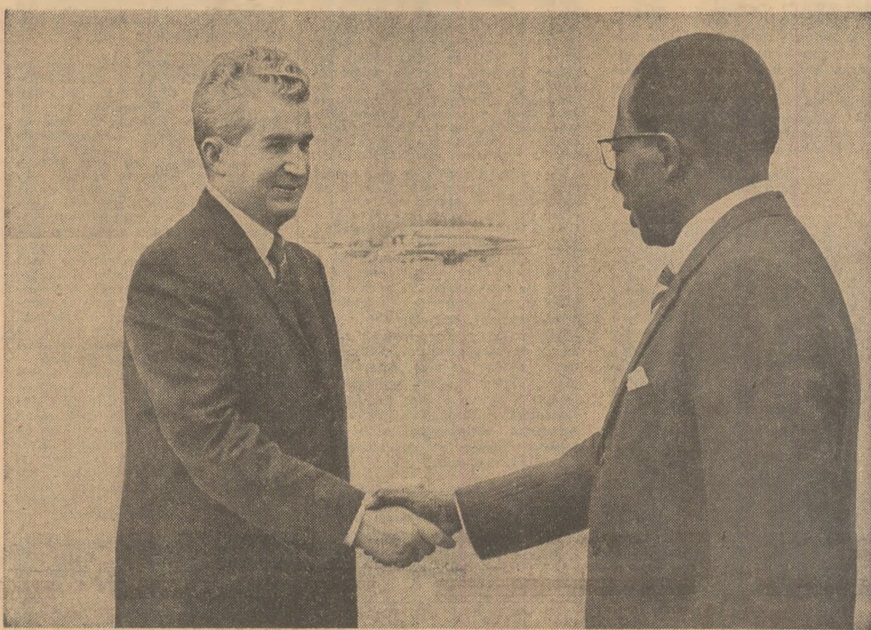
La sosire, pe aeroportul Otopeni

Dineu oficial oferit de președintele Nicolae Ceaușescu și tovarășa Elena Ceaușescu în onoarea președintelui Léopold Sédar Senghor și a doamnei Colette Senghor