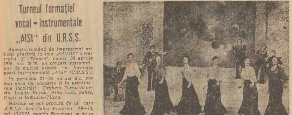
Turneul formației vocal-instrumentale „AISİ” din U.R.S.S.