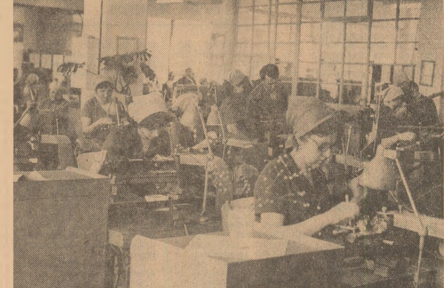
Produce de calitate superioară - deviza colectivului întreprinderii „Victoria”

Realizarea planului și a angajamentelor la export, reducerea la strictul necesar a importului - iată tema pe care o abordăm în ancheta întreprinsă în câteva întreprinderi din județul Arad.