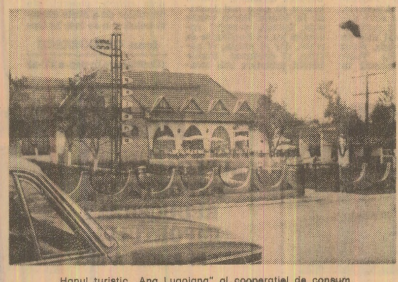
Hanul turistic „Ana Lugojana” al cooperării de consum

Și în județul Timiș, ca pretutindeni în țară, cooperanța de consum a constituit și amenajă noi și atractive popasuri turistice. Astfel, la numai 9 kilometri de orașul Lugoj, pe D.N. 68 A (Lugoj) — Făget — Deva), într-o pitorească zonă de dealuri și livezi, turșii și la dispoziție un agreabil loc de popas și recreare. Este vorba de banul „Ana Lugojana”. La restaurantul unității pot fi servite gustoase preparate culinare, multe dintre ele specifice bucătăriei bănățene. Tot în județul Timiș, în localitatea Făget, se află o altă unitate a cooperării de consum — complexul turistic „Pădurea” — care asigură vizitatorilor săi o plăcută ospitalitate. Complexul dispune de camere cu confort modern, încălzire centrală și un restaurant elegant.