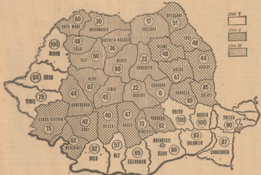
Stadiul însămînțării porumbului - în procente față de suprafața planificată...

au existat în diferite unități în folosirea tractoarelor și semănătoarelor.