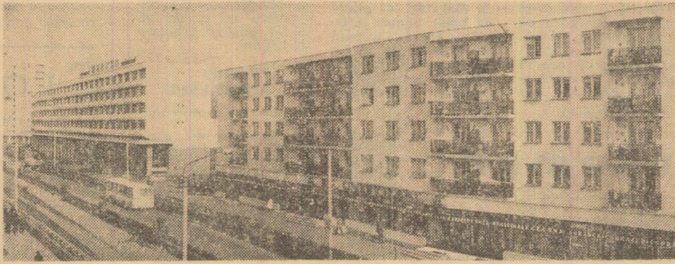
Noi dimensiuni urbane la Bistrița