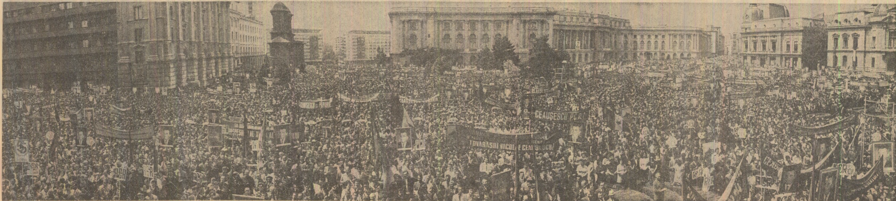
Ieri, la marea manifestație populară din Capitală. (Citit în pagina a IV-a relatarea reporterilor „Scînteia”)

Este cunoscut că, imediat după înfăptuirea actului istoric de la 23 August, armata română a întors armele împotriva Germaniei hitleriste, a luptat alături de glorioasa (Continuare în pag. a III-a)