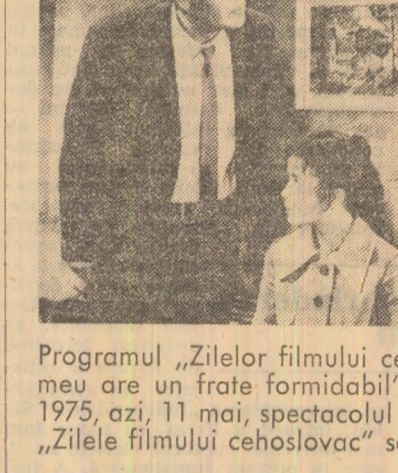
Programul „Zilelor filmului cehoslovac” cuprinde, în afară de spectacolul cu filmul „Fratele meu are un frate formidabil”, film distins cu Medalia de argint la Festivalul de la Moscova 1975, azi, 11 mai, spectacolul cu filmul „„Iubi re”, iar la 12 mai — „Îndrăgiiții anului 1”...

La Casa filmului din Capitală a avut loc, luni seară, inaugurarea „Zilelor filmului cehoslovac”, organizate cu prilejul celei de-a XXXI-a aniversări a eliberării Cehoslovaciei de sub dominația fascistă.