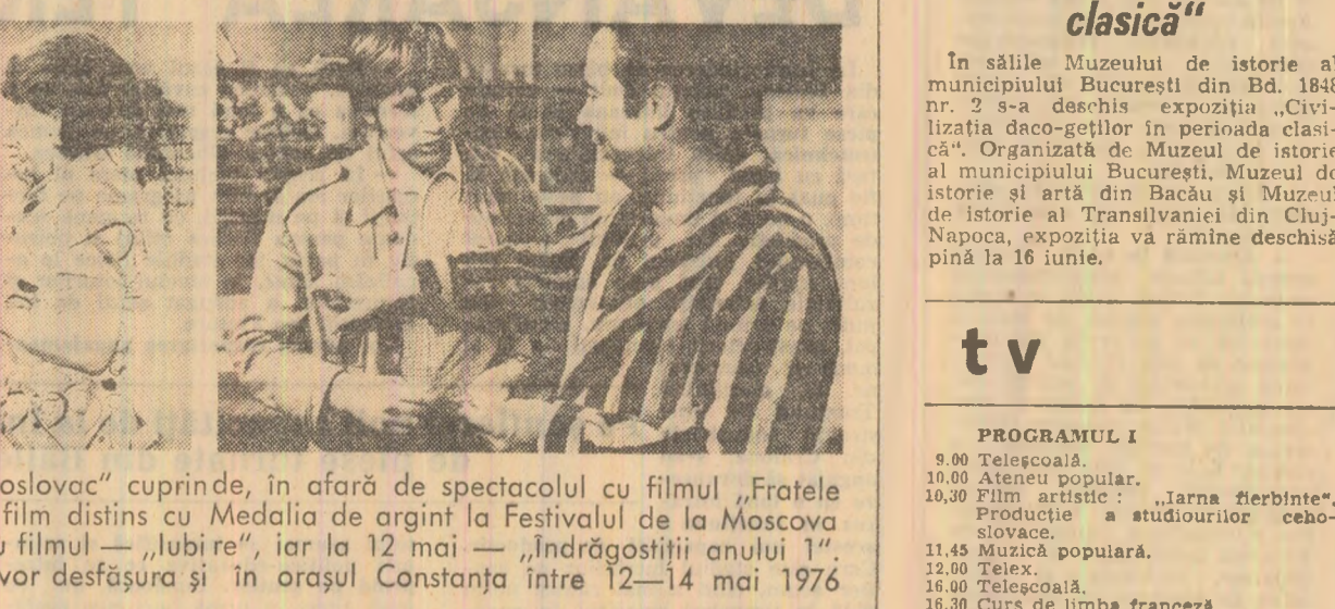
Programul „Zilelor filmului cehoslovac” cuprinde, în afară de spectacolul cu filmul „Fratele meu are un frate formidabil”, film distins cu Medalia de argint la Festivalul de la Moscova 1975, azi, 11 mai, spectacolul cu filmul „„Iubi re”, iar la 12 mai — „Îndrăgiiții anului 1”...

Programul I: 9.00 Telegolă. 10.00 Ateu popular. 10.30 Film artistic: „Iarna fierbinte”. Producție a studiourilor cehoslovace. 11.45 Muzică populară. 12.00 Telex. 12.00 Telegolă. 13.30 Curs de limba franceză. 17.00 Telex. 17.05 Scena. Emisiune de actualitate teatrală. 17.25 Românie, nume scump. Melodii populare. 17.40 Lecții TV pentru lucrătorii din agricultură. 18.10 Telegolă. 18.30 Film de televiziune: „Ștefan cel Mare”. 19.30 Telegolă. 20.00 Telegolă. 20.25 Melodii populare. 20.40 Lina dramaturgică originală românească: „Bălcescu” de Camil Petrescu. Prima parte. 21.15 Telex. 21.25 Spectacolul lumii (XVI). 21.45 Portulul 76.