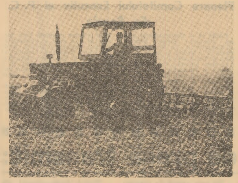
La cooperativa agricola „Calea belșugului” din Brastavoi, judetul Olt, (in imagine) se execută prima pragă mecanică pe ultimele suprafețe cultivate