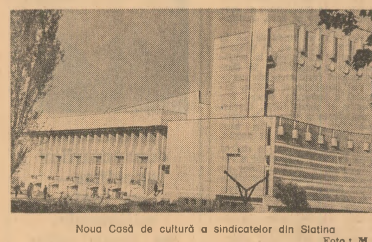
Noua Casă de cultură a sindicatelor din Slatina.