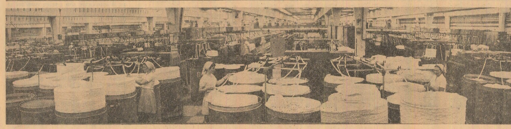
Filatura de bumbac din Baia Mare. Imagine din secția preparatie