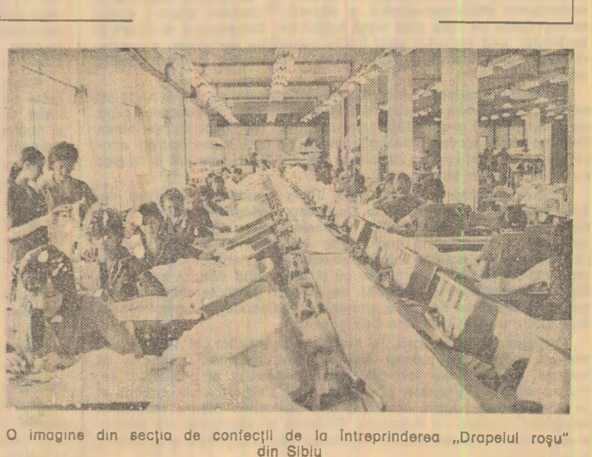
O imagine din secția de confecții de la întreprinderea „Drapelul roșu” din Sibiu