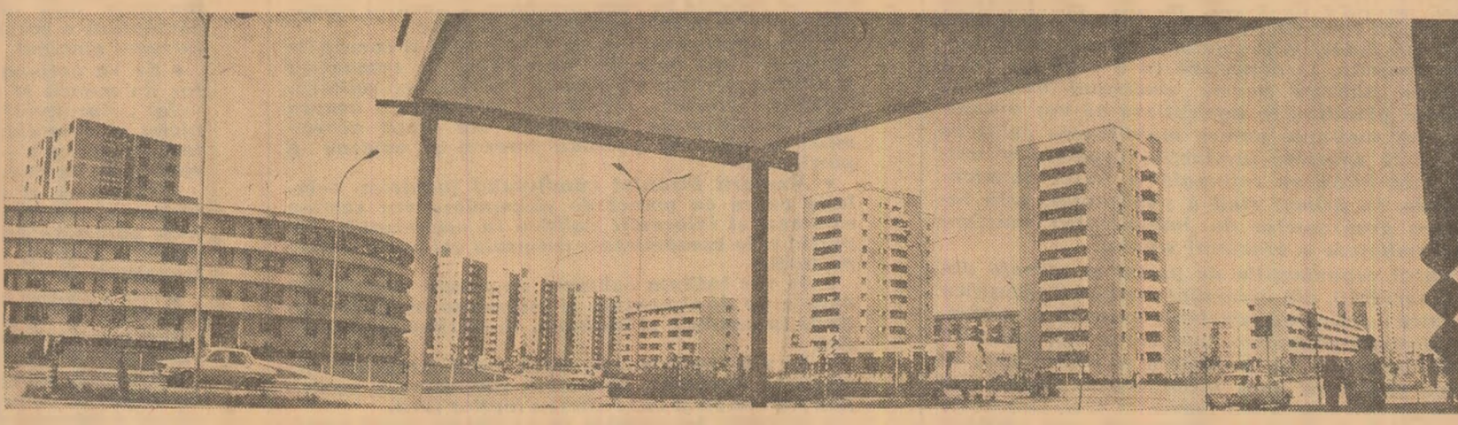
Slotina: Noua înfățișare a cetății aluminiului românească

Tînărul colectiv muncitoresc al Întreprinderii de transformatoare mici din Filiași continuă șirul succesorilor în întrecerea socialistă. Astfel, în aceste zile a trecut probele de stand cel deal al 5.000-lea transformator realizat aici de la începutul acestui an. Cu acesta, numărul transformatoarelor fabricate în unitatea doljencă de la începerea producției a ajuns la 34.000, din care aproape 50 la sută au fost livrate clienților externi. (Nicolae Băbălu).