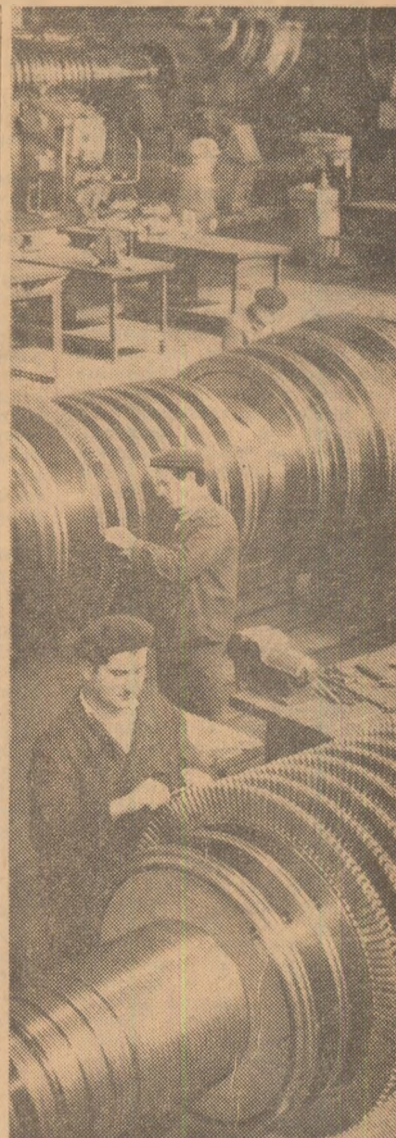
Aspect cotidian din secția de turbine a întreprinderii de mașini grele din București

In pagina a IV-a a ziarului — relatări din județele Buzău și Dolj.