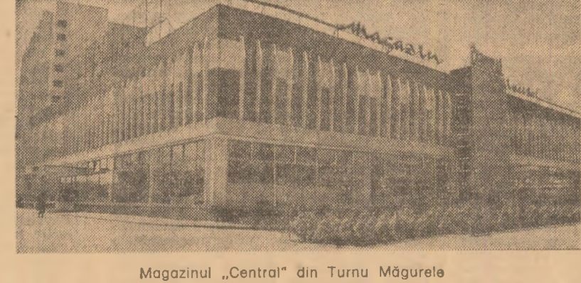
Magazinul „Central” din Turnu Măgurele

Din statisticele întocmite de Inspectoratul General al Miliiei de circulație, precum și o culegere de cîntece, jocuri și povestiri pentru preșcolari. A sporit, în ultimii ani, numărul patrulelor școlare, alungind în prezent la 7.000, cu peste 40.000 de elevi. În prezent, în 16 județe ale țării funcționează 25 de parcuri-școli de circulație. O mare extindere a căpatat metoda instruirii regulilor de circulație în cadrul cercurilor auto-moto-carling, care numără aproape 40.000 de membri, și a cercurilor tehnico-aplicative, cu peste 21.000 de tineri.