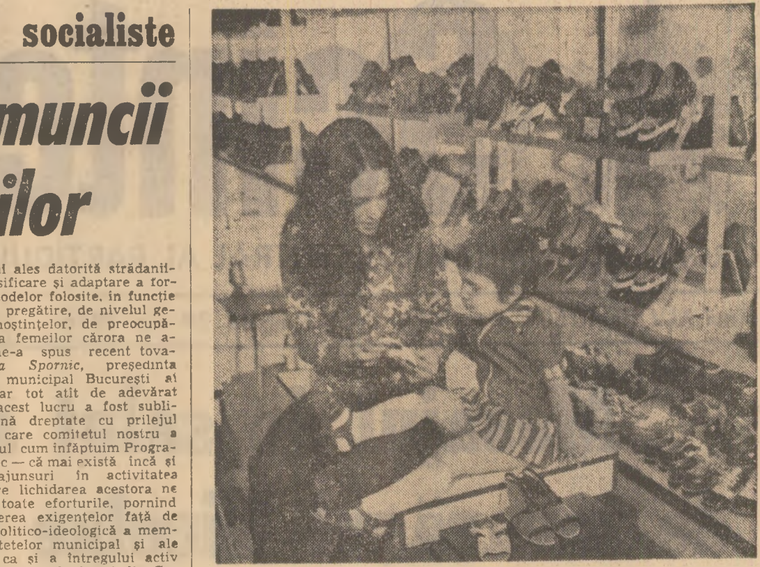
A intrat în tradiție ca în fiecare an, de 1 Iunie, Ziua copilului, magazinele cooperatiste de consum din întregul țării să fie bine aprovizionate cu un larg sortiment de cadouri frumoase și utile. O mare varietate de articole pentru copii oferă raioanele cu îmbrăcăminte și încălțăminte: pantalonasi, bluze, tricotate, ciorapi, ghete, sandale. Librăriile văstești și raioanele specializate din magazine oferă cărți din colecțiile pentru copii și elevi: „Prima mea bibliotecă“, „Traista cu povești“, „Povești nemuritoare“ și „Biblioteca școlară“, precum și sticluri, pixuri, cutii cu creioane colorate. Tot în magazinele cooperatistelor de consum se găsesc diverse jocuri distractive, jucării mecanice, păpuși, biciclete, trotinete, dulciuri.

Prima zi calendaristică a verii este consacrată, pe plan internațional, copilului. S-ar putea spune că în țara noastră ziua copiilor nu este doar la 1 Iunie, ci în fiecare zi, întrucît preocuparea societății noastre pentru creșterea, educația și sănătatea celor mici, este permanentă. Ea se manifestă, între altele, în realizarea unui număr de la un an la altul mai mare de construcții sociale și școlare, capabile să asigure — în toate localitățile — condiții din ce în ce mai bune pentru creșterea și educarea tinerelor vîlăstare ale țării. Se alocă în acest scop, de la bugetul statului, din fondurile sociale ale sindicatelor și ale organizațiilor cooperatiste sume mereu mai mari. Astfel, în actualul an școlar, numărul copiilor înscrși în cele peste 13.500 de grădinițe se ridică la aproximativ 812.000, aproape dublu față de anul școlar 1970/1971; aproape 34.000 de cadre didactice se ocupă, cu competență și răbdare, de îngrijirea și educarea preșcolarilor. Numărul locurilor în creștere a înregistrat, de asemenea, un spor considerabil: de la circa 30.000 — în 430 de creșe cîte funcționau în 1970 — la peste 73.000 — în 765 de creșe, la eșfritul anului trecut. Și capacitatea leagănelor a crescut, avînd acum peste 9.500 de locuri.