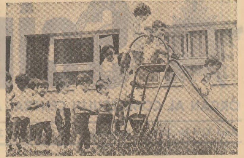
Primi pași... către inedit.