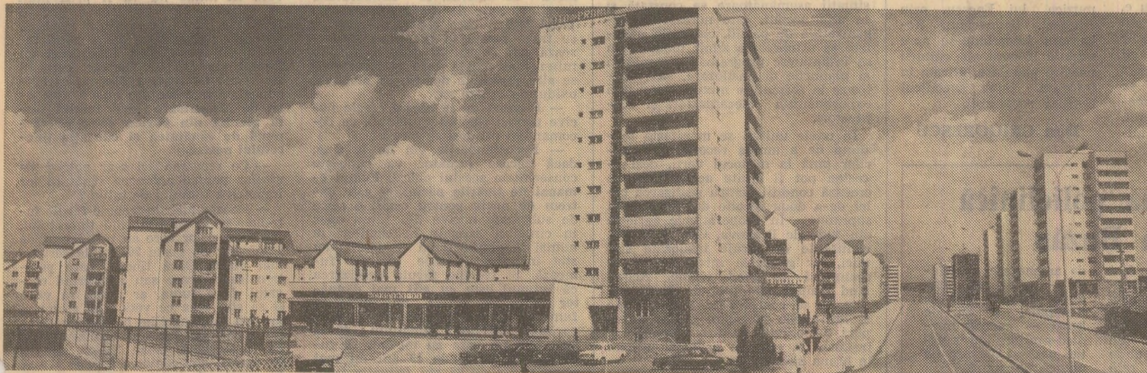
Construcții noi, moderne la Miercurea Ciuc