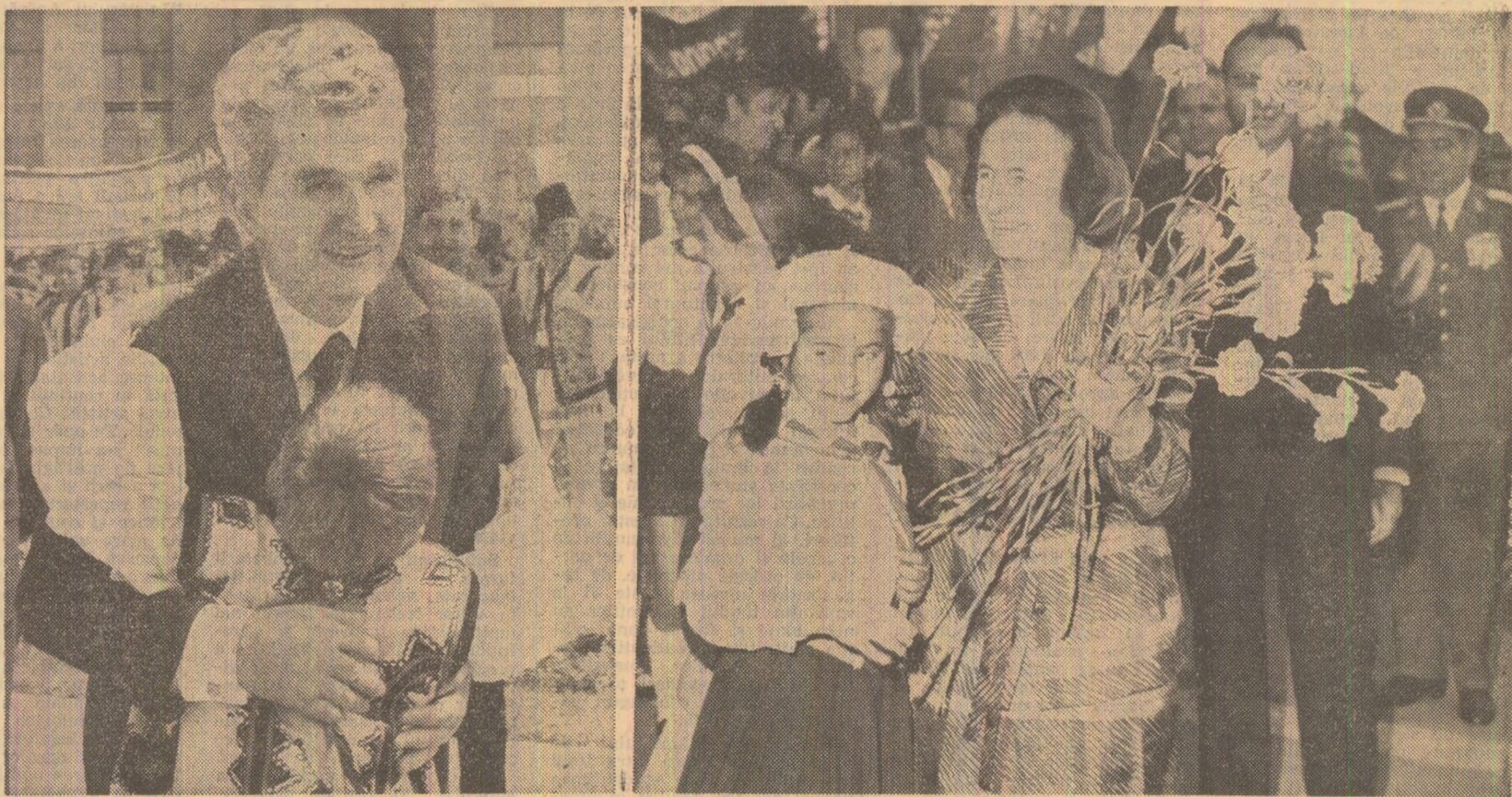
Imagini emoționante ale calduroasei manifestări populare care a urmat încheierii Congresului

Noi sîntem gata să discutăm aceste probleme cu toate statele. Dorim ca oamenii noștri de știință și cultură să discute aceste probleme