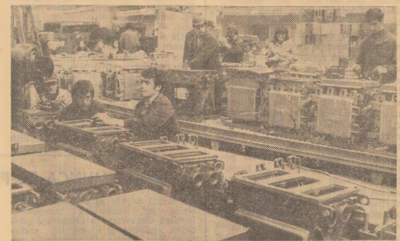
Tineri muncitori, într-o întreprindere tînăra — „Electrocontact” Botoșani