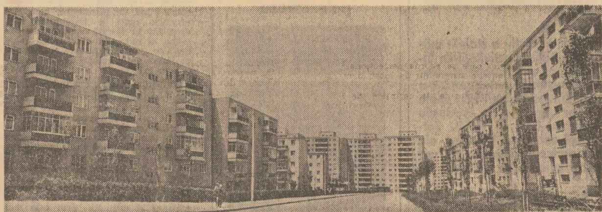
Cortierul Tomis din Constanța

— Mai presus de orice însă — ținea să sublinieze uteciștii Ion Donea — a fost cîștigul moral: colectivul echipei se simte acum mai sudat ca oricînd și pentru toți problema principală e să fim în toate împre-