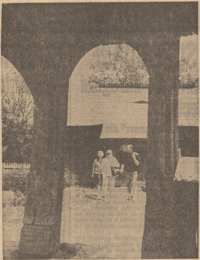
Muzeul Satului din Capitală — permanent punct de atracție pentru turiști din țară și de peste hotare