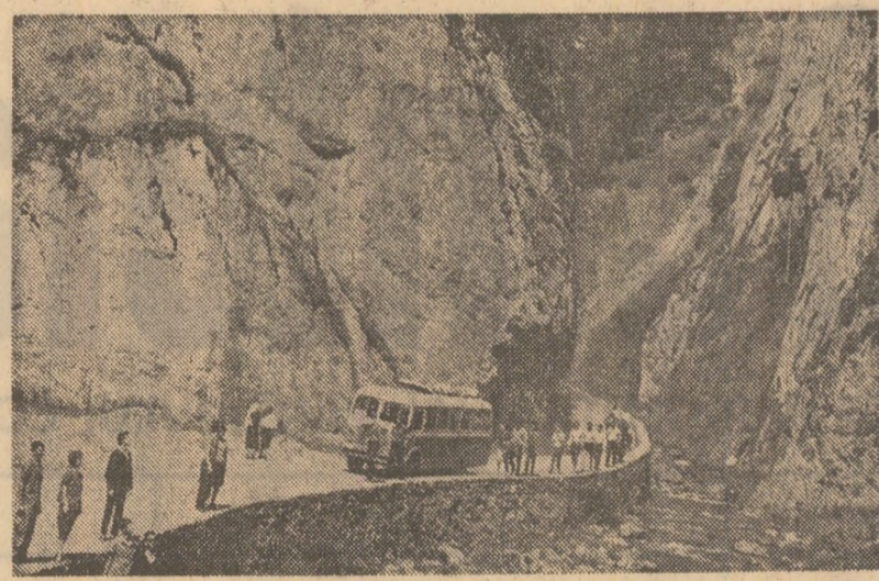
Unul dintre cele mai pitorești locuri turistice ale patriei: Cheile Bicazului