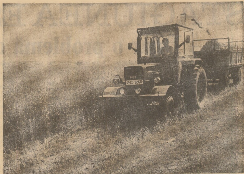
O lucrare de actualitate în agricultură: recoltarea și înlăozarea furajelor. În fotografie, aspect de la cooperativa agricolă Jilul, județul Cluj, unde se recoltează secara pentru masă verde de pe ultimele suprafețe.