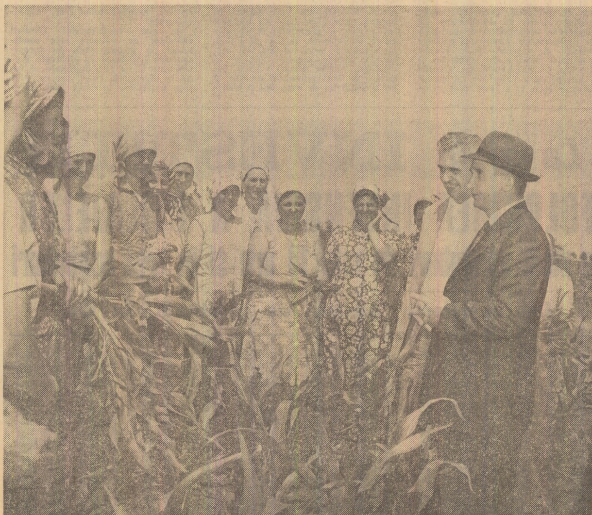
În lanurile de porumb ale C.A.P. Purani