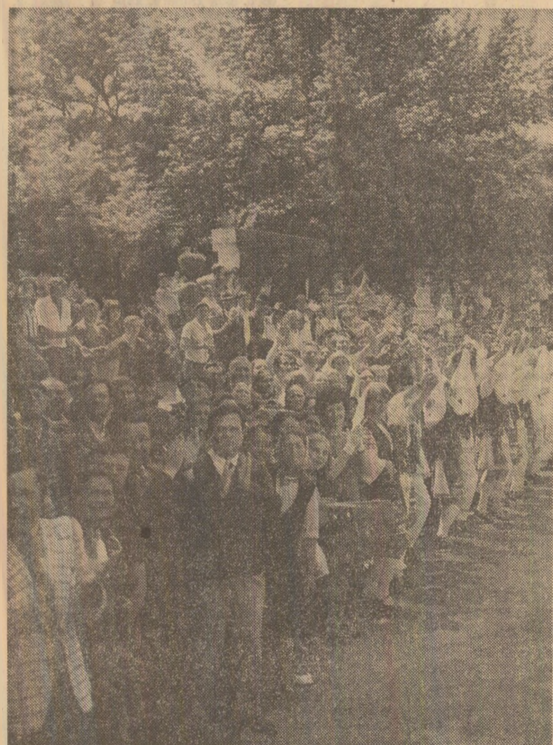
Primire călduroasă la Zimnicea