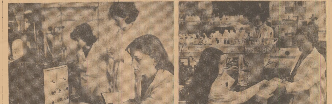
Studenții efectuează cercetări în cadrul Facultății de chimie a Universității „Babeș-Bolyai” din Cluj-Napoca.