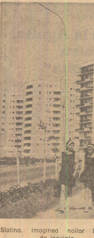
Slatina. Imaginea noilor blocuri de locuințe

Romulus CAPLESCU (Continuare în pag. a V-a)