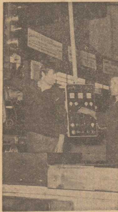
Se fac probe la o nouă mașină de oșchit metale A.F.-85 la intrînderea de mașini-unelte din Bocou

Să facem totul pentru ca din recolte a acestui an să nu se piardă nici un bob, pentru ca sămînța celor de-a doua recolte să ajungă cit mai repede sub brazdă!