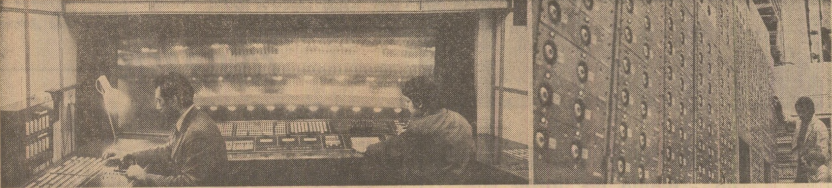
La pupitrul de comandă. Dar nu într-o modernă secție industrială — așa cum ne-au obișnuit fotoreporterii — ci în culisele Teatrului Național „I. L. Caragiale” din București! De aici, de la orga de lumină, „se dirijează” simfonia policromă a scenei.

„Noi avem izvoare nesecate care, dacă bei din ele, te întinerec, îți dau noi puteri de viață, îți stimulează forța creatoare. Renunțați deci, dragi tovarăși scriitori și artiști — dar și lucrători din alte domenii — să căutați sau să alergați după tot felul de ulcioare care de care mai smîlțuite, dar de cele mai multe ori cu o băutură fără gust, stătută și deci dăunătoare.”