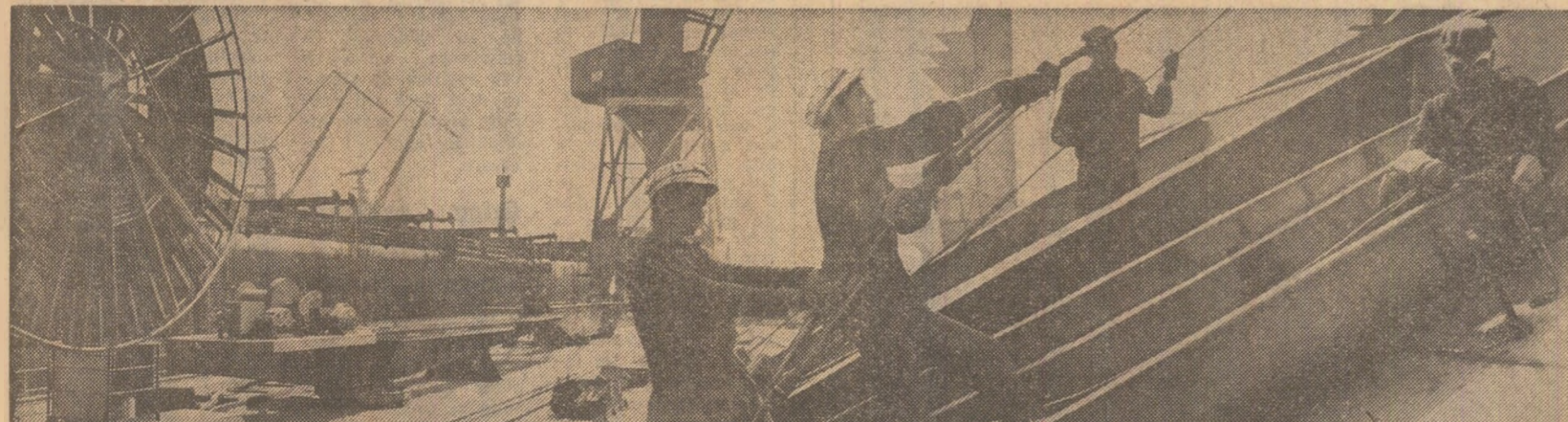
O imagine din munca hîrniceilor constructori de nave constanțeni

„Micro — 16” este numele noului cartier de locuințe a cărui construcție a început de curînd la Satu-Mare, pe malul stîng al Someșului. Pe o suprafață de 35 ha vor fi înălțate aici blocuri între 4 și 11 niveluri, care vor însuma 8.000 de apartamente (5.000 vor fi terminate în actualul cîmp), 3 școli cu 72 săli de clasă, 1.075 locuri în creșe și grădinițe, un dispensar uman cu 4 circumscripții, un club cu teatru de vară, spații comerciale și pentru prestări de servicii, terenuri de joacă și sport, spații verzi. Imbinînd judicioasă criteriile de funcționalitate cu cele de eficiență economică, proiectanții au amplasat la parterul blocurilor nu numai spații comerciale, ci și cele pentru creșe, grădinițe și dispensar. (Octav Grumeza).