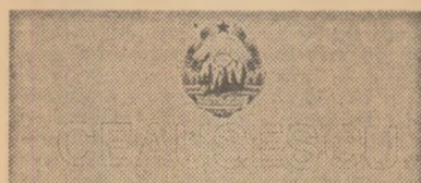
DÜN, BUGÜN VE YARIN Kİ