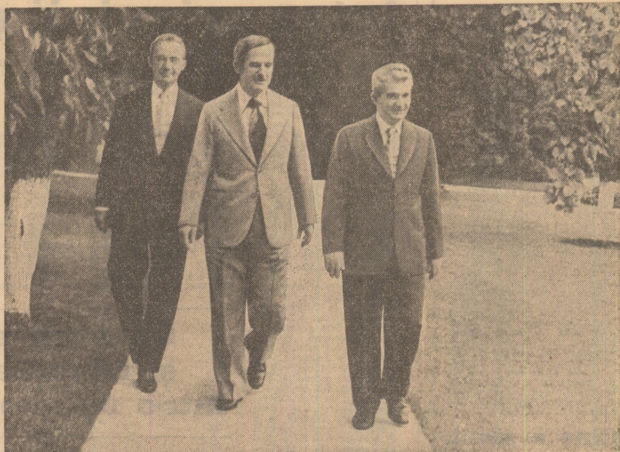
Moment din timpul întâlnirii, duminică, la Snagov

Președintele Hafez Al-Assad și doamna Anisă Al-Assad au adresat președintelui Nicolae Ceaușescu și tovarășei Elena Ceaușescu invitația cordială de a face o vizită oficială de prietenie în Republica Arabă Siriană. Invitația a fost acceptată cu plăcere, data vizitei urmînd a fi stabilită ulterior.