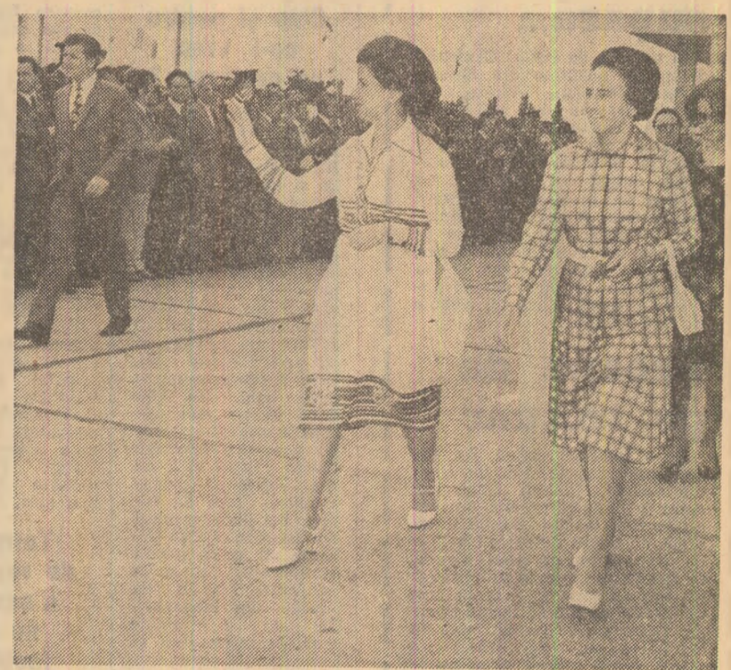
La plecare, pe aeroportul internațional Otopeni