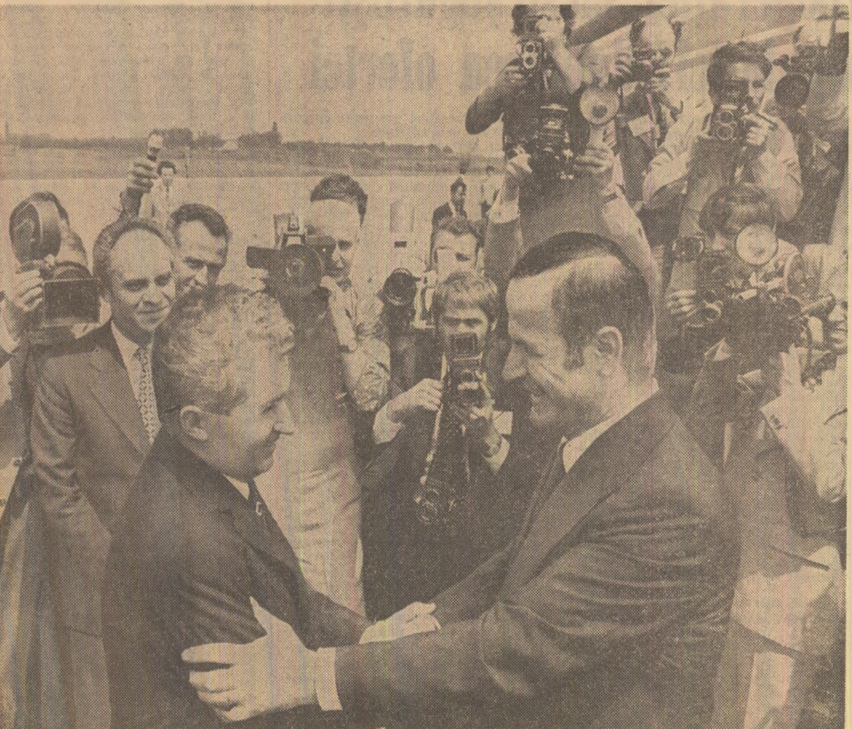
La plecarea pe aeroportul Otopeni (Relatarea ceremoniei în pagina a III-a)

Nu pot să închei aceste cuvinte fără a multumi în mod deosebit președintelui Nicolae Ceaușescu, doamnei Elena Ceaușescu, tuturor prietenilor români. Exprim cele mai bune și sincere sentimente în numele meu, al soției mele, al delegației siriene, al poporului arab din Siria și adresez calde urări pentru progresul și prosperitatea poporului român prieten. (Aplauze).