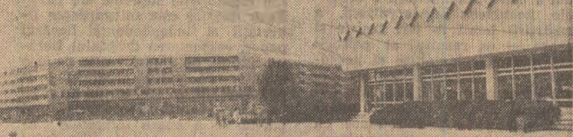
Noul centru civic al Tulcei

mului de alimentație a copilului. Intrucît sîntem confrunțați cu destule cazuri de deficiențe în acest sens. Se știe că de o alimentație variată, corectă, în funcție de vîrsta copilului și care ține seama de regulile de igienă, de un orar adecvat, depinde foarte mult dezvoltarea psihică și fizică a copilului. Putem îngrășa un copil cu gris, dar ca să i se dezvolte intelectul are nevoie de proteine superioare, de vitamine. De aceea, pentru însușirea regulilor de igienă a copilului și de preparare a alimentelor facem chiar și lecții practice cu mamele. Separat de „școala mamei”, care durează între o oră și două zilnic, fiecare medic de salon discută cu mamele internate și cu copiii mai mari despre afecțiunile respective, dînd sfaturi, recomandări, etc. Acestă experiență a spitalului clinic central de copii „Grigore Alexandrescu” din București merită să fie extinsă, în forme adecvate, și în alte spitale în care se interesează de copii, inclusiv în maternități. AL. PLAIEȘU