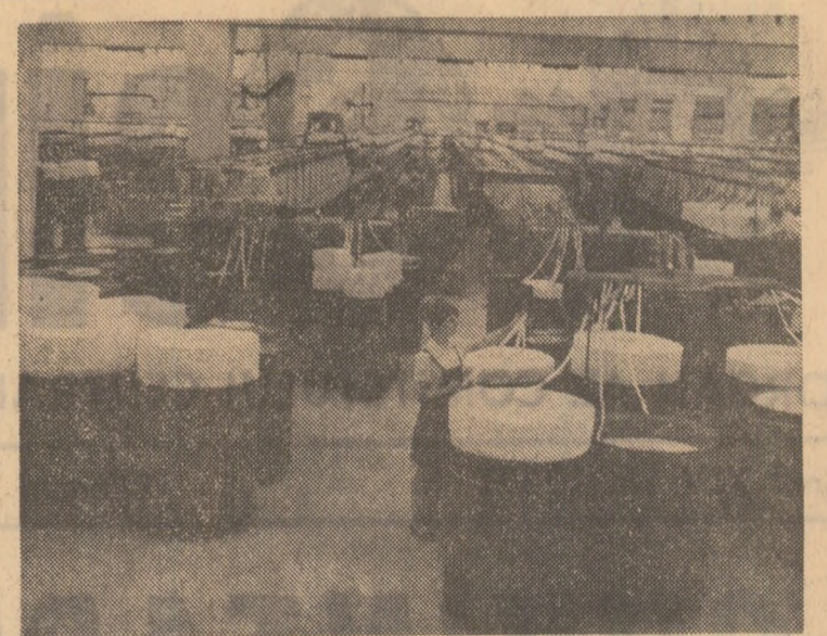
O valoroasă inițiativă la „Textila”-Galați: