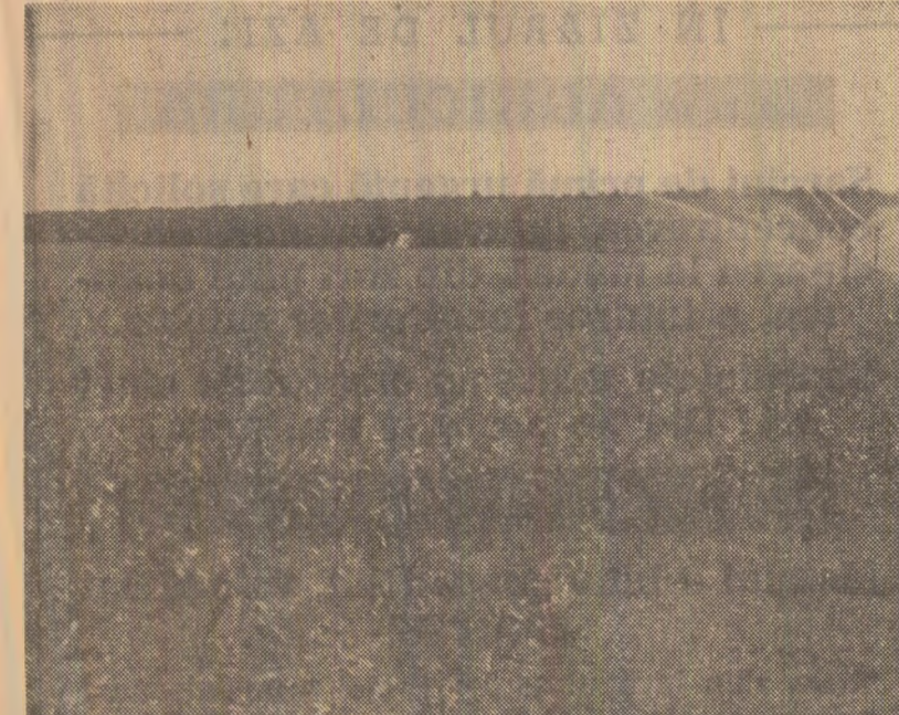
La întreprinderea agricolă de stat Sadova, județul Dolj, activitatea de irigare a culturilor este temeinic organizată. „Ploaia artificială” nu conține nici o clipă, ziua și noaptea. În fotografie, lanurile de porumb primesc apă pentru a doua oară.