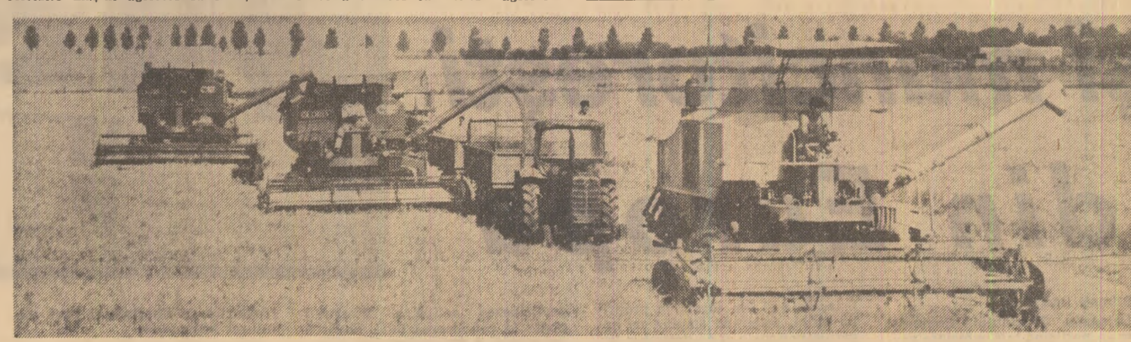
Recoltarea orzului la I.A.S. Căldărași, județul Ialomița