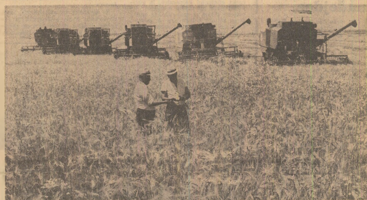
Recoltarea orzului pe ogoarele C.A.P. Odoreu, județul Satu-Mare

ționale. Îndeosebi probleme legate de situația din Orientul Mijlociu, subliniindu-se necesitatea continuării eforturilor pentru soluționarea pe cale politică a situației din această zonă care să ducă la retragerea trupurilor din teritoriile arabe ocupate, la restabilirea drepturilor legitime ale poporului palestinian, inclusiv crearea unui stat palestinian independent, la instaurarea unei păci juste și trainice. În acest context, a fost relevată și necesitatea de a se acționa ferm pentru încetarea cîr mi grabnică a conflictului din Liban pe calea tratativelor, fără ingerințe străine și fără să se recurgă la confruntări armate, în vederea restabilirii păcii și respectării independenței, suveranității și integrității acestei țări. Întreprinderea s-a desfășurat într-o atmosferă cordială, prietenească.