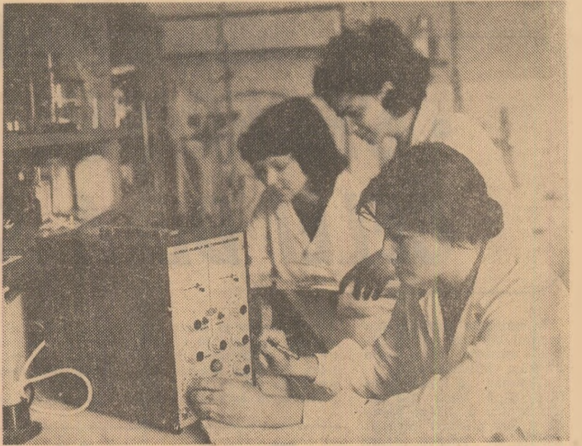
Practică studentescă la Institutul de chimie al Universității din Cluj-Napoca.

obraz! — circula mai ales în limbajul „profesional” al aplicatorilor. Nu o dată alternanța sinonimelor angajează termenii cu sensuri figurate. „Adă-i aminte, să cheamă din pielea” cîntă noi attea chipuri pe care le-am înțeles altădată, în altă lume. Între noi și ele s-a pus perspectiva timpului — ceea ce depășește le dă o ușoară linie artistică, ce nu poate dăuna realității. Alteori intră în acțiune seriile sinonimice: „Omni cu nasul roș a adus un șip verde. Glasuri n-auz. Dar vîd pe urias că pune gafa la gură și trage, pe urmă o dă bărbosului și bărbosul răstoarnă capul pe spate și stă mult așa, mult — parca a încremenit. Apoi se îndreaptă, privește sticla în zărea focului și iar o pune la gură”. Sinonimul simplu poate fi substituit printr-o expresie sau locuțiune, cum se întâmplă în textele următoare: „Se va vedea că o mulere a fost pricina năpăstuirii lui Ferid, după cum multe din cumpenele lumii și dururile omenești s-au iscat și se iscă tot din pricina amăgîrilor dulci ale ficelilor Evei!”, „E adevărat că măria ta pot găsi iertare dacă scurtezi pe un fiu de voievod. Desi-i cu primejdie iacă-i ești capul, dar poți găsi iertare”.