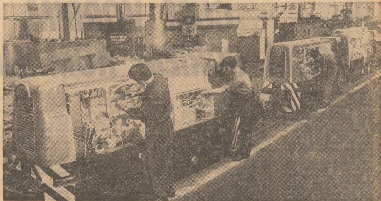
Întreprinderea UNIO din Satu-Mare: o ultimă verificare la un nou lot de locomotive pentru mînd