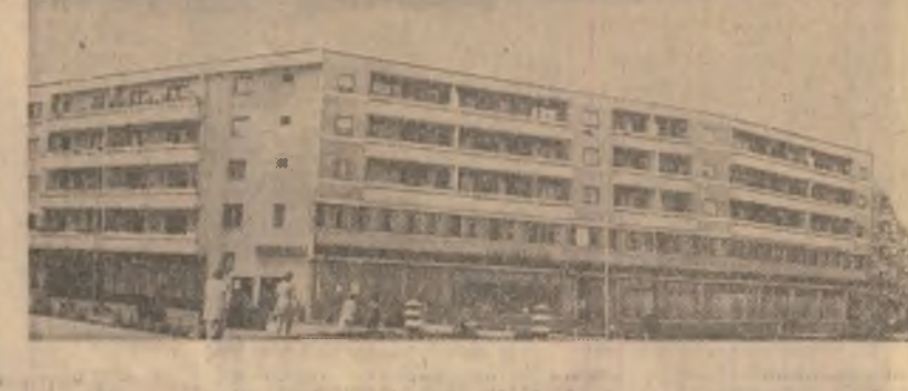
Noul centru civic al Tulcei

Florian TANASESCU Situate în localul pitoresc, cuobile pe ocupările turistice Pîșeu, Potoci, Ardeuța, Durău, Dochia sau 7 Noiembrie — toate din județul Neamț — cunoscut în aceste zile o mare afloare de vizitatori, alți din țară, alți de peste hotare. Prin priza ofițerului județean de turism, în aceste apreciate și solicitate locuri de popas au fost luate din timp măsuri pentru diversificarea serviciilor și îmbogățirea meniuului. De asemenea, în orașul reședință al județului — Piatra Neamț — după darea în folosință a hotelului „Central” cu 11 etaje, a fost inaugurat și un popas turistic situat pe traseul revoluției tehnico-stiințifice înseamnă, nu numai introducerea tot mai accentuată a progresului tehnic, ci, mai ales, afirmarea plenară a conștiinței muncitorești înaintate, corespunzătoare pentru cultura tururilor acestui progres. În context, lupta pentru calitatea muncii trebuie să devină tot mai mult o „cauză personală” a fiecăruia, să poliarizeze preocupările educative ale tuturor factorilor de rîspundere. Calitatea, în sensul cel mai strict, ci este în sensul cel mai larg al noțiunii, așa cum este înțelesă de exigențele Codului etic — reprezintă un seismograf fidel al sursurilor conștiinței socialiste a fiecărui om, la fiecare loc de muncă. Titus ANDREI Cezar IOANE