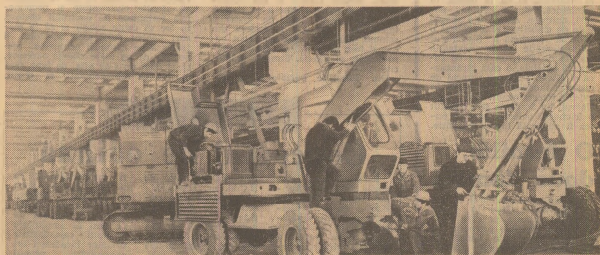
Scenă cotidiană de muncă la întreprinderea de utilaj greu „Progresul” din Brăila

prezidențial a fost conferit Întreprinderii de utilaj greu „Progresul” Brăila ordinul „Steaua Republicii Socialiste România” clasa I.