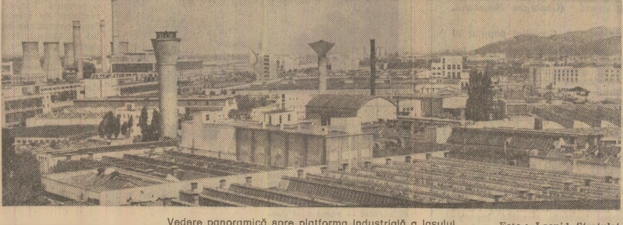
Vedere panoramică spre platforma industrială a loșului

Este, după părerea mea, principala sarcină care ne revine, în această etapă, ca educatori și cetățeni, ca lucrători pe țărîm practic al dezvoltării spirituale.