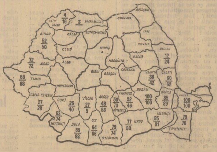
STADIUL RECOLTĂRII GRÂULUI LA DATA DE 20 IULIE a.c. Cifrele înscrise în perimetrul fiecărui județ indică: sus — suprafața recoltată (în procente) în cooperativele agricole de producție, iar jos — în întreprinderile agricole de stat

tități suplimentare de legume, fructe și alte produse agroalimentare, contribuind astfel la o mai bună aprovizionare a populației, așa cum se prevede în Programul elaborat din inițiativa și sub direcția dumneavoastră îndrumare, privind producerea și desfacerea bunurilor de consum în perioada 1976-1980. În prezent, toți lucrătorii ogoarelor, în frunte cu comunistii, sînt mobilizați pentru realizarea în bune condiții a celorlalte lucrări de sezon, în vederea realizării întocmai a angajamentelor asumate în întrecerea pe anul 1976. Vă asigurăm, mult stimate tovarășe Nicolae Ceaușescu, că, mobilizații de mîinutal dumneavoastră exemplul, de înălțat patriot revoluționar, organizația județeană de partid, toți oamenii muncii din județul Buzău vor acționa cu toată energia, cu toată dăruirea pentru înfrățirea măsurilor stabilite de recenta plenară a Comitetului Central al Partidului Communist Român, a indicatorilor pe care ni le dați permanent, în vederea realizării exemplare a sarcinilor ce ne revin din Programul de faurire a societății socialiste multilaterale dezvoltate și înaintare a României spre comunism, adoptat de Congresul al XI-lea al partidului.