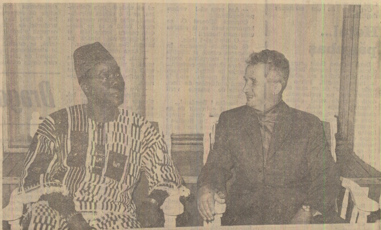
În timpul întrevederii dintre cei doi președinți