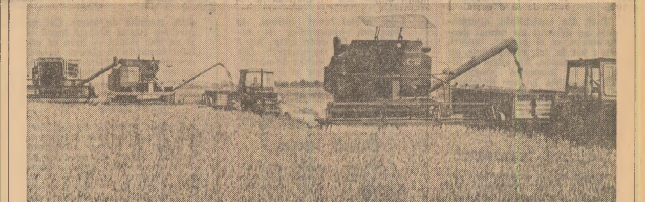
Se recoltează ultimele suprafețe cu grîu la cooperativa agricolă Pleșoiu, județul Olt.