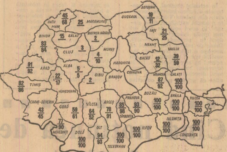
STADIUL RECOLTĂRII GRIULUI la data de 26 iulie a.c. Cifrele înscrise în perimetrul fiecărui județ indică: sus — suprafața recoltată, în procente, în cooperativile agricole, iar jos — în întreprinderile agricole de stat