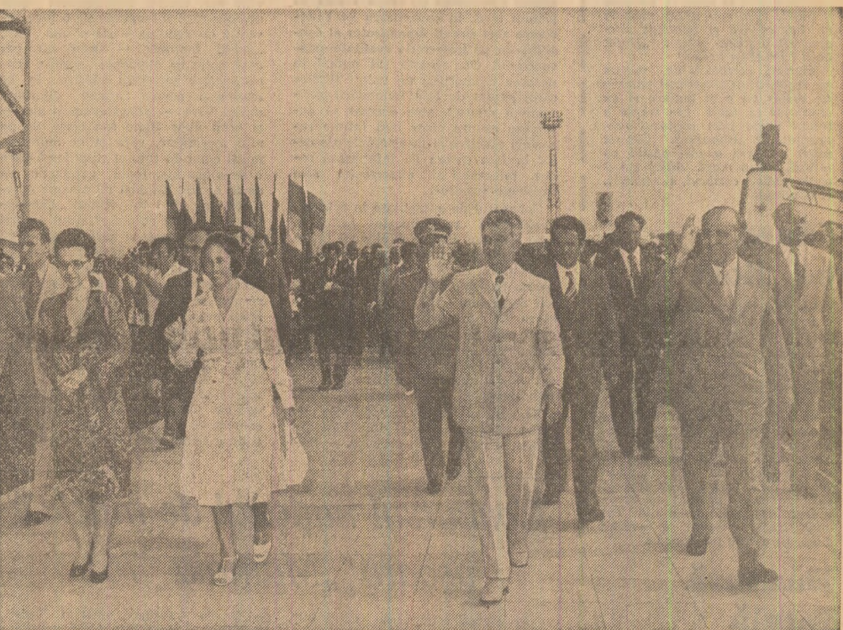
Pe aeroportul internațional din Varna