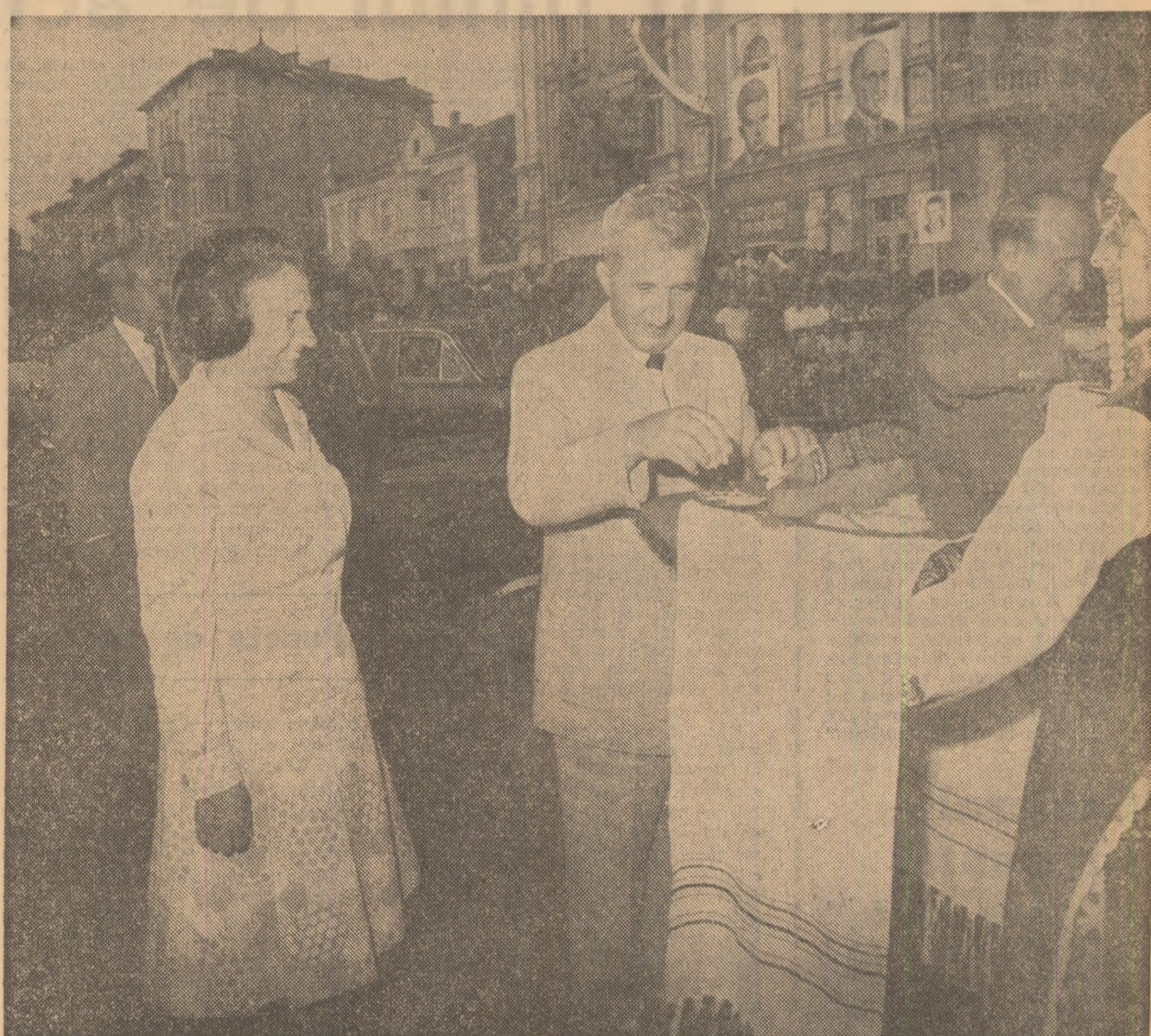
Primire tradițională, prietenească