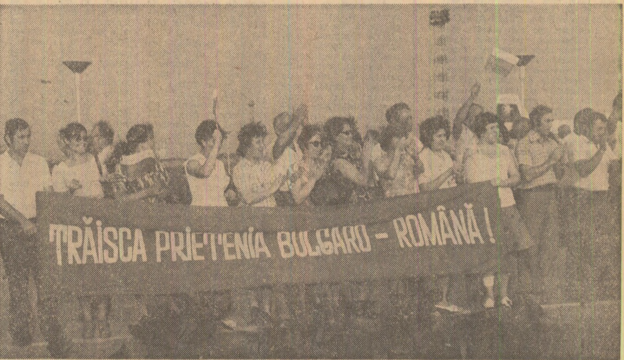
Salut călduros înalților oaspeți români