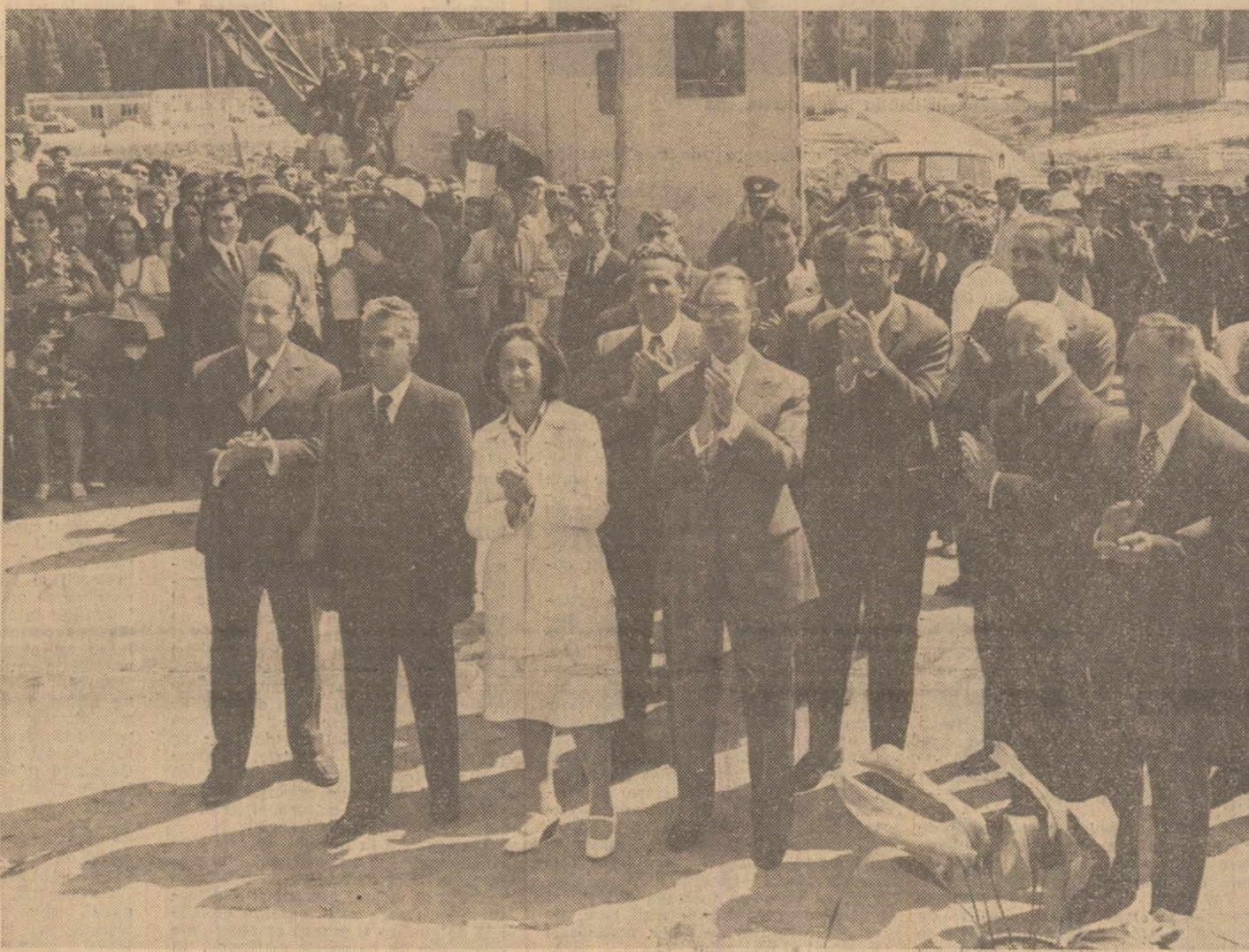
La inaugurarea lucrărilor de construire a Combinatului de utilități grele