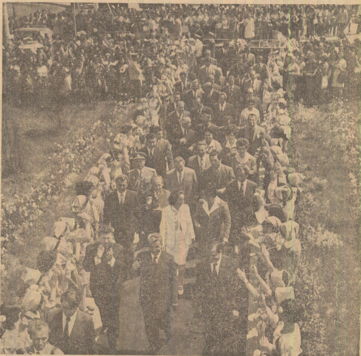
Primire entuziastă la Fabrica de confecții