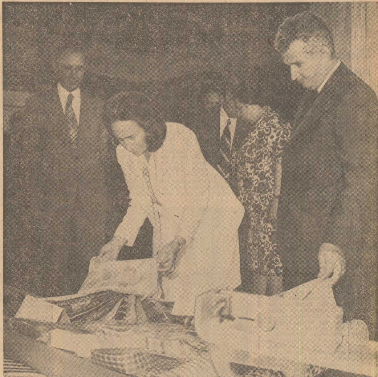
Se analizează produsele realizate de cadrele didactice și studenții de la Facultatea de industrie ușoară

În încheiere, doresc să vă urez încă o dată succese tot mai mari în întreaga activitate din toate sectoarele, multă sănătate și multă fericire! (Aplauze puternice, prelungite; se scandează „Ceaușescu — P.C.R.!” „Ceaușescu și poporul!”). Cei prezenți în marea piață a orașului ovaționează îndelung pentru Partidul Comunist Român, pentru Comitetul Central, pentru secretarul general al partidului, tovarășul Nicolae Ceaușescu).