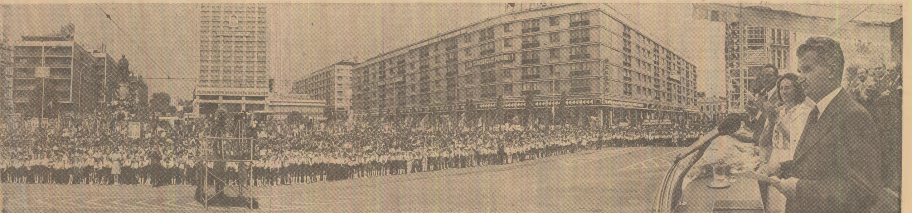
O imagine de la adunarea populară din Piața Unirii

● Secerișul ● Însămînțarea celei de-a doua culturi: După combină — plugul, după plug — semănătoarea! ● Recoltarea și însilozarea furajelor IN PAGINA A IV-A