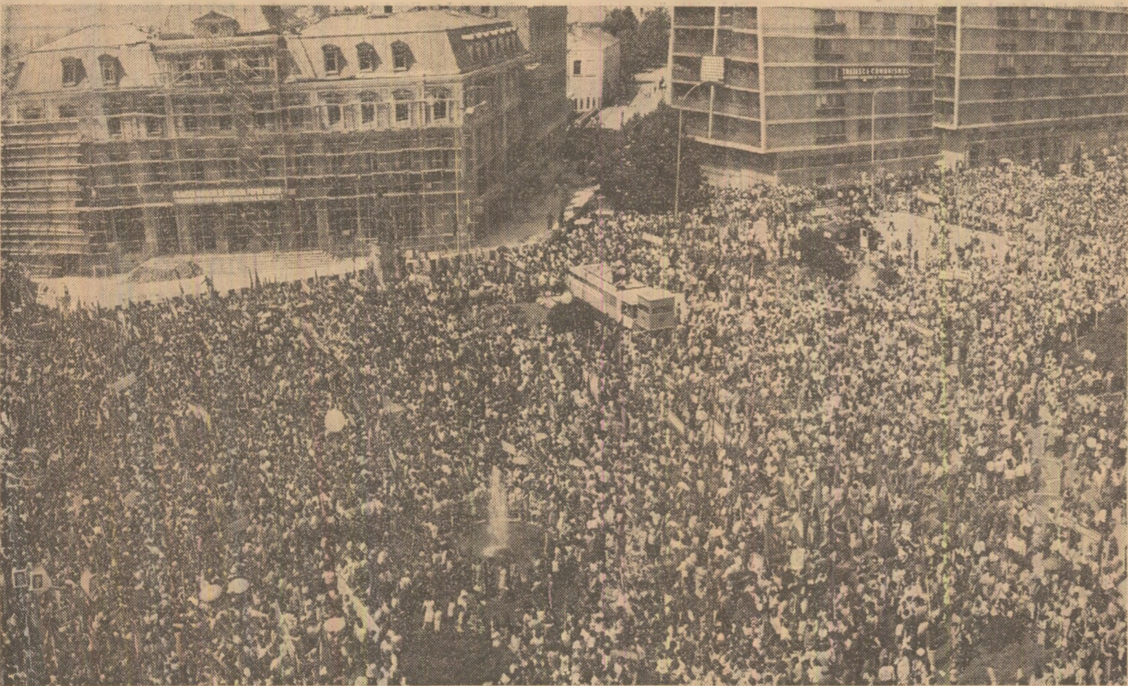
Aspect de la marea adunare populară