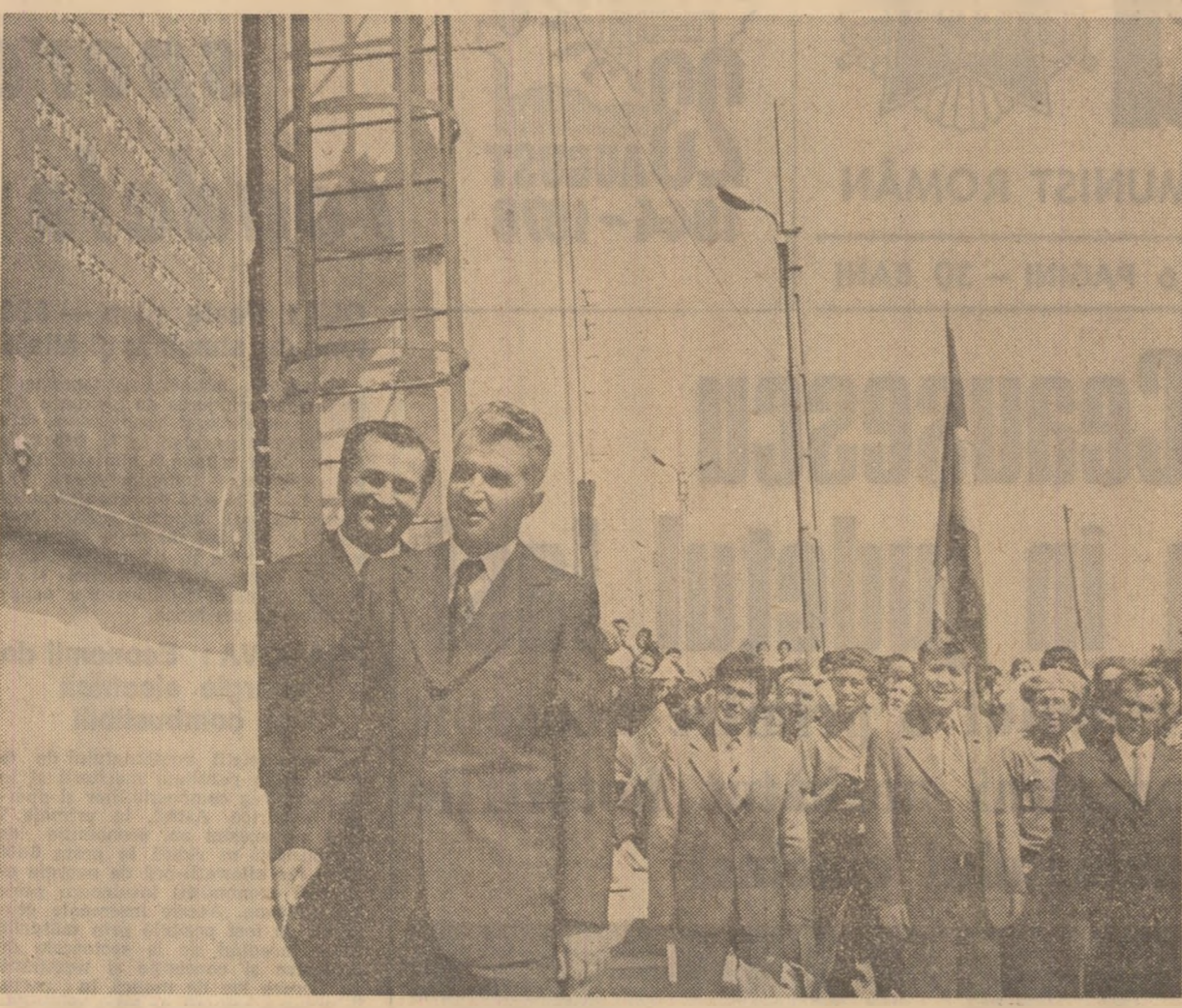
Dezvelirea plăcii care consemnează un moment deosebit în istoria industriei ieșene

Secretarul general al partidului este informat că întreprinderea a înfruntat parțial în funcțiune, cu două luni în avans față de termenul prevăzut, ceea ce permite realizarea unei producții globale suplimentare de circa 1.000.000 lei. În fata machetelor, a graficelor se subliniază preocuparea existentă în uni-