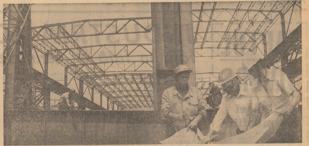
Se lucrează cu spor, în ritm intens, pe șantierul noul hale productive din cadrul întreprinderii de mașini grele din Capitală