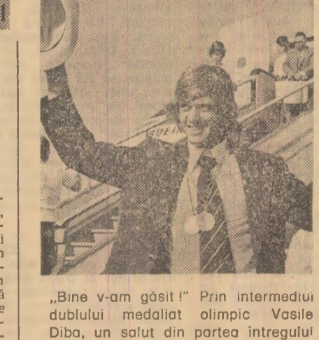
„Bine v-am găsit!” Prin intermediul dublului medalist olimpic Vasile Diba, un salut din partea întregului lot

Dacă la volan fiind vi se-ntîmplă să vă iasă în cale un om cu casa după el (gabarit depășit), vă recomand s-o țineți cît mai pe dreapta, la nevoie să-nclăcați trotuarul — și totul se va-ncheia cu bine Din Militari, din alte două cartiere, privesc mereu asemenea oameni cu casele după ei, mereu, și-n miez de zi, și-n miez de noapte — cu destinația: șantierele de construcție ale Capitalei. Chiar dacă nu-i cunoașteți personal, merită să le adresați un salut: poate că ei transportă tocmai viitorul dumnea-voastră apartament. Cei mai mulți poartă băști, nu pe-o ureche, ci trase cu nădejde pe cap, așa, să stea. Tîn pîrul strîns, și-l apără de praaf, de fum. De ce nu sepeți? Sepele au co-zoroc și mereu te simți îndemnat să tragi de el într-o pîmpingă spre ceață și asta îți abate atenția de la drum. Oamenii cu casele după ei, cîntărețorașul (ocolind arterele centrale), într-o încordare maximă, adesea extenuan-