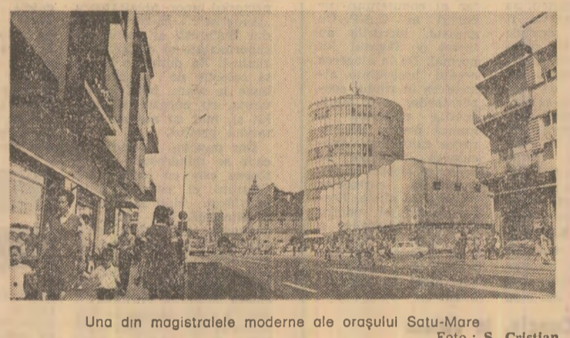
Una din magistralele moderne ale orașului Satu-Mare