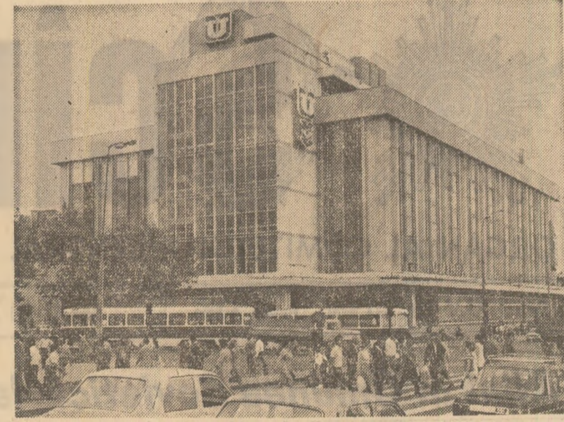
Marele magazin „Unirea”

absentaseră de la program. Ne înterăm de sarcinile concrete ale fiecăruia din zile respective și din zilele anterioare. Nimeni nu știa precis ce anume are de făcut. Unii zăboveau ironic: „Păi ce, numărăm noi cîte tractoare de gunoi se clepoartă la rampă?” Nimeni nu ține nici o evidență de decantere, „treapta a doua”, fiind pline de suspensii, au o eficiență redusă. Din totalul de 12 (doișprezece) paturi de uscare a nămolului (proiectul a prevăzut 10) sint în stare de funcționare numai 4 (patru), dar și ele încorect întreținute și exploatare. Pe teritoriul ocu-