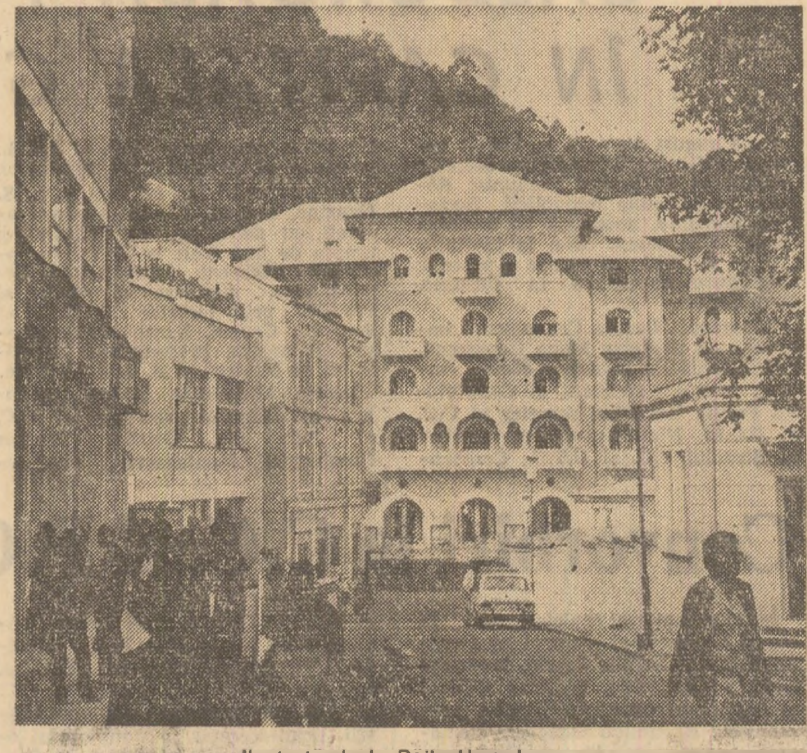
Ilustrato de la Boile Herculane

glementare a desfacerii băuturilor alcoolice. În cadrul consfătuirii s-au subliniat sarcinile imediate și de perspectivă ce revin lucrătorilor din alimentația publică. S-a insistat asupra necesității îmbunătățirii activității de servire a consumatorilor, largirii gamei de preparate culinare cu accent pe mîncărurile tradiționale cu specific local, a sporirii sortimentului și desfacerii consumului de băuturi răcoritoare și ape minerale, a perfecționării cadrelor și îmbunătățirii stării de igienă. (Nicolae Mocanu).