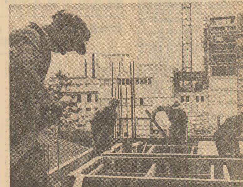
Întreprinderea „Tîndra Gardă” din București: se lucrează intens pentru realizarea la timp a noii capacități de producție

Utilizînd cu randament sporit capacitățile de producție și timpul de lucru, metaleștii și alții din fabricile de aluminiu din Tulcea au obținut în acest an rezultate remarcabile în muncă. După succesul înregistrat luna trecută, cînd la toate instalațiile întreprinderii s-au atins parametrii producției, recolta a fost anunțată o nouă realizare: îndeplinirea planului pe opt luni cu 25 de zile mai devreme. Cu producția realizată pînă la sfîrșitul lunii iulie, colțul ridicat stăruiește în trecut volum de producție obținut în cursul anului 1975. (Vasile Nicolae).