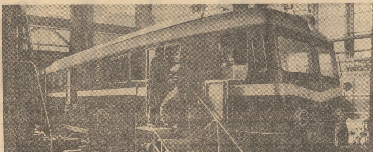
Ultimele verificări ale unei noi locomotive la întreprinderea „Electroputerea” din Craiova.