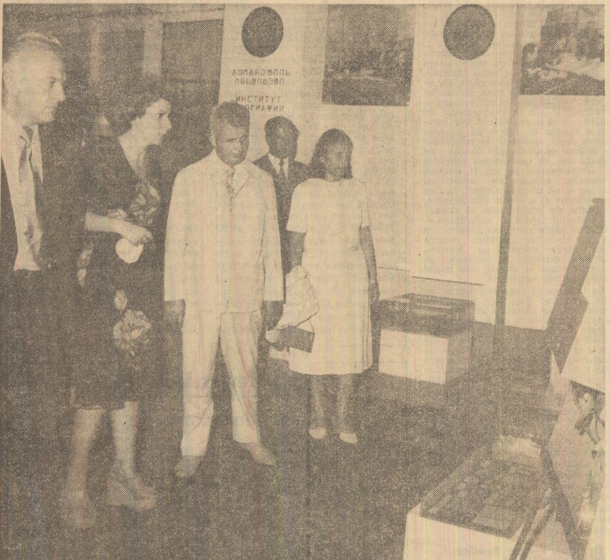
La Expoziția realizărilor economiei naționale a R.S.S. Gruzine

La intrare, oaspeții români sînt întîmpinați și salutați cu căldura de directorul expoziției, Sota Djavahisvili, de Leovar Mamaladze, arhitectul-constructor al expoziției, de specialiști și lucrători din cadrul expoziției. Expoziția reprezintă o grăitoare ilustrare a realizărilor dobîndite de R.S.S. Gruzină în dezvoltarea economiei naționale și ridicarea nivelului de trai al poporului. În fața unor machete sugestive, grafice și panouri, precum și a diferitelor expozate, gazele prezintă principalele realizări obținute de oamenii muncii din republică în industrie, agricultură, învățămînt și știință, artă și cultură, în creșterea bunăstării materiale și spirituale. Sînt vizitate pavilioanele care reflectă dezvoltarea științei și tehnicii, a industriei agroalimentare, a industriei ușoare și industriei locale, precum și pavilionul de plante subtropicale. La încheierea vizitei, tovarășul Nicolae Ceaușescu, apreciind realizările ogîndite de expozatele prezentate în cadrul expoziției, a urat oamenilor muncii din Gruzia socialistă prietenă noi și mari progrese pe drumul dezvoltării economiei naționale, al fîuririi unei vieți îmbelsugate și fericite.