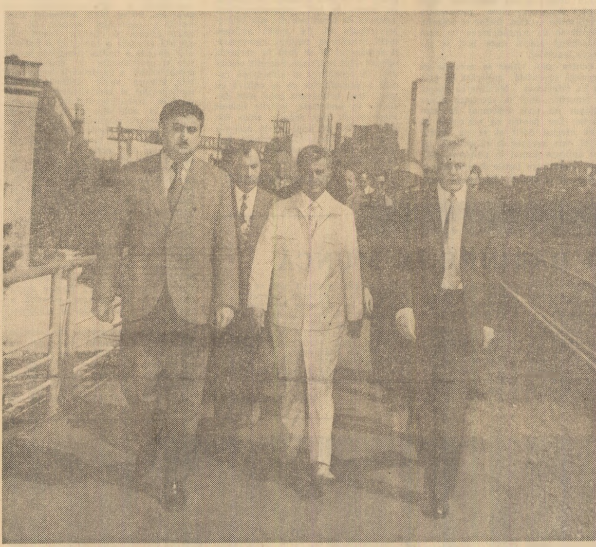
La Uzina metalurgică din Rustavi

● Primire călduroasă, prietenească la Uzina metalurgică din Rustavi ● Pretutindeni, în toate locurile vizitate, manifestări vii de stimă deosebită pentru înalții oaspeți români