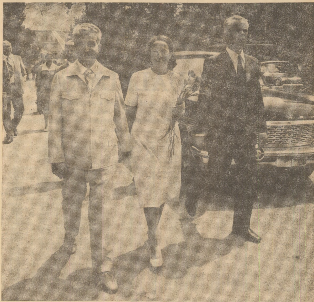
Atmosferă caldă, prietenească

În timpul dineului, care s-a desfășurat într-o atmosferă plină de cordialitate, a fost prezentat un frumos program de cîntece și dansuri interpretat de artiști de seamă ai R.S.S. Gruzine.