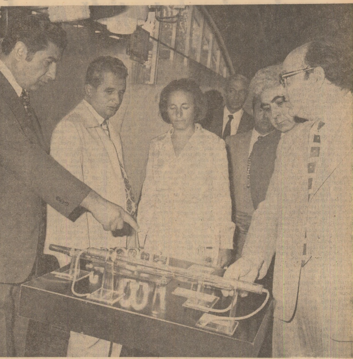
La Expoziția realizărilor economiei naționale a R.S.S. Armeană

int vizitate standurile care înfățișează dezvoltarea industriei construcției de mașini, electronice, chimice, de materiale de construcții, de prelucrare a lemnului, precum și standurile industriei ușoare și alimentare. La încheierea vizitei, tovarășul Nicolae Ceaușescu și tovarăsa Elena Ceaușescu au consemnat următoarele în cartea de onoare a expoziției: „Ne-a făcut plăcere să vizităm Expoziția realizărilor economiei naționale a R.S.S. Armeană - care înfățișează marile succese obținute de oamenii muncii din Armenia sovietică în dezvoltarea industriei și agriculturii, în modernizarea producției și ridicarea nivelului de trai. Uram din inimă poporului armean prietenilor și mari realizări pe calea înfloririi economice și sociale a patriei, a fâuririi socialismului și comunismului".