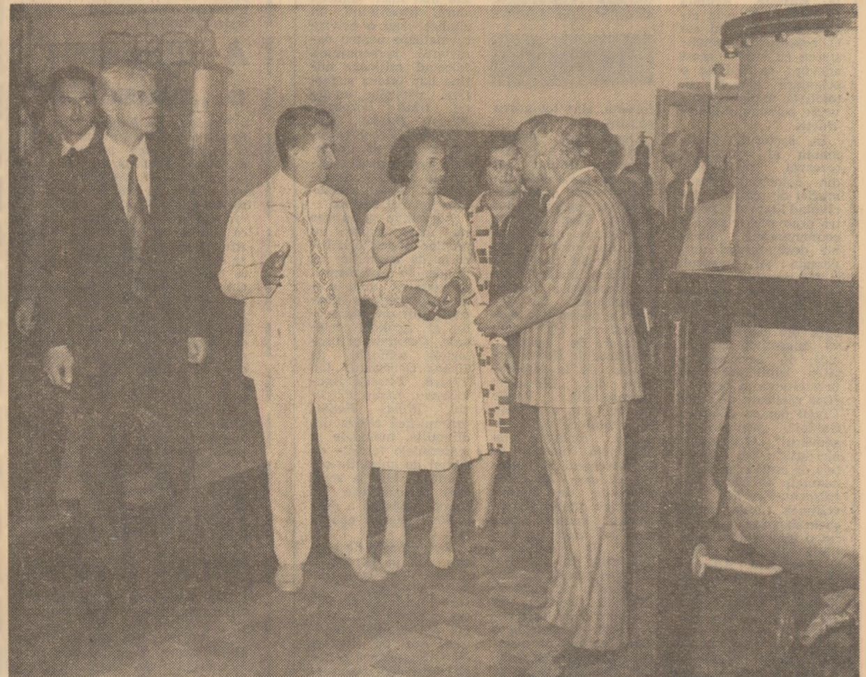
La Institutul de chimie organică fină