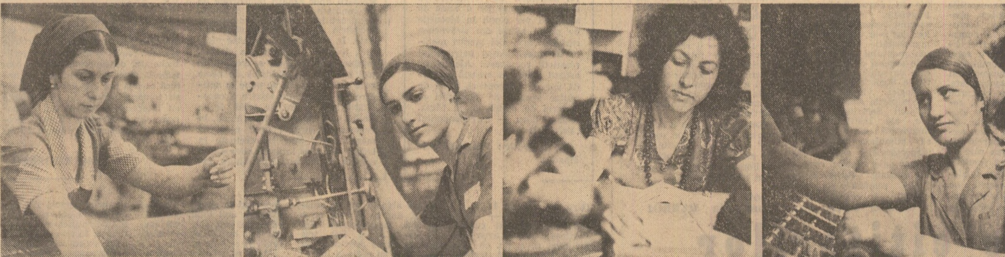
LA ÎNȚEBERAREA „DOROBANȚULUI” DIN PLOIEȘTI, „bătălia” calității se desfășoară pe tot parcursul fluxului de fabricație, de la recepția materiilor prime și materialelor, până la obținerea produselor finite...