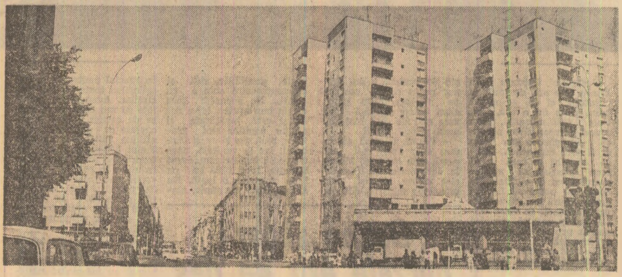
În centrul orașului Satu-Mare