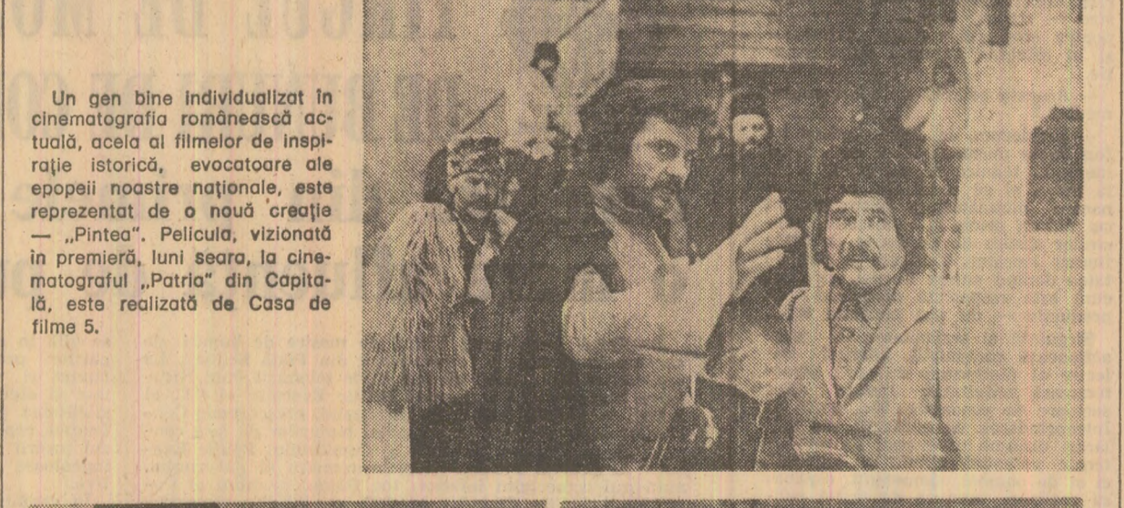
Un gen bine individualizat în cinematografia românească actuală, acela al filmelor de inspirație istorică, evocatoare ale epopeii noastre naționale, este reprezentat de o nouă creație — „Pintea”. Pelicula, vizionată în premieră, luni seara, la cinematograful „Patria” din Capitală, este realizată de Casa de filme 5.

a cărei premieră a avut loc aseară în sala cinematografului „Patria” din Capitală