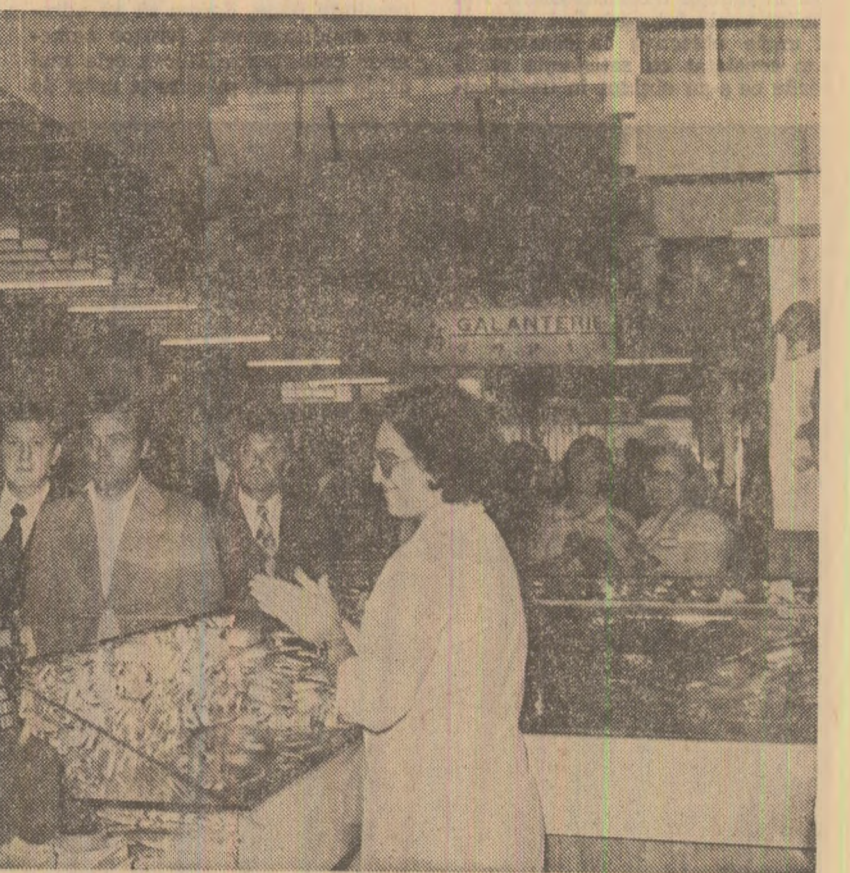
La magazinul universal „Diana”

La încheierea mitingului, în drum spre reședință, tovarășul Nicolae Ceaușescu și tovarășa Elena Ceaușescu străbat adevărate coloare vii, răspund cu prietenie acclamațiilor, manifestațiilor entuziaste, pline de căldură ale locuitorilor orașului.