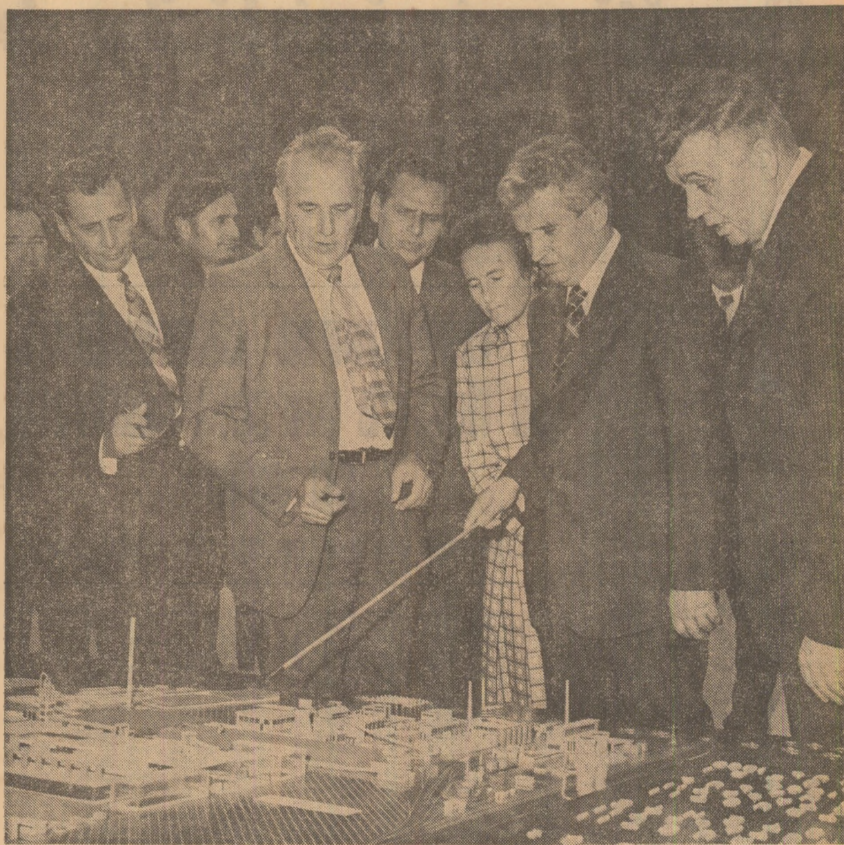
La uzina de aluminiă

În încheiere doresc, încă o dată, să exprim convingerea că organizația de partid din județul și municipiul Tulcea, toți comunistii, oamenii muncii din toate întreprinderile și instituțiile, precum și de la sate, toți cetățenii județului vor face totul pentru a-și îndeplini cu cinste sarcinile mărețe ce le revin în cadrul planului cincinal, că vor aduce o contribuție tot mai activă și tot mai importantă la înfăptuirea Programului elaborat de Congresul al XI-lea al partidului. (Aplauze puternice, urale; se scandează: „Ceaușescu și poporul”, „Ceaușescu — P.C.R.”). Cu această convingere vă urez dumneavoastră, tuturor comunistilor și oamenilor muncii din Tulcea succese tot mai mari, multă sănătate și multă fericire! (Aplauze puternice, îndelungate. Toți cei prezenți la marea adunare populară ovacionează, într-o atmosferă de puternic entuziasm, pentru Partidul Comunist Român, pentru Comitetul Central, pentru secretarul general al partidului, tovarășul Nicolae Ceaușescu).