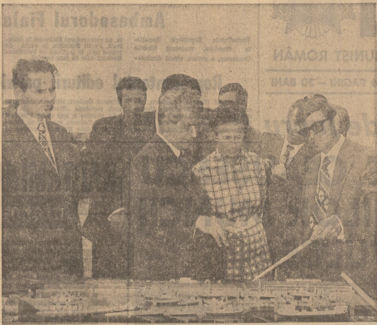
Se vizitează șantierul de construcție a viitorului șantier naval

Avîndu-se în vedere rezultatele obținute, experiența acumulată, importanțele obiective ce se cer îndeplinite, exigențele actualului cincinal al revoluției tehnico-stiințifice, s-au stabilit măsuri concrete, de evidență însemnată pentru economia județului și a țării, ele vizînd, în principal, dezvoltarea bazei metalurgice — premisă indispensabilă a unei industrii puternice și moderne — a construcției de nave, ridicarea întregii activități economice la un nivel calitativ superior, valorificarea mai deplină a resurselor materiale și umane locale, îmbunătățirea continuă a nivelului de viață al celor ce muncesc.