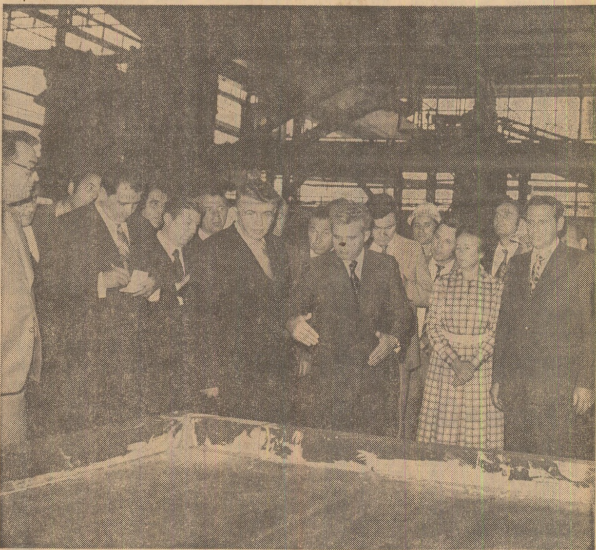
În halele uzinei de ferroaliaje