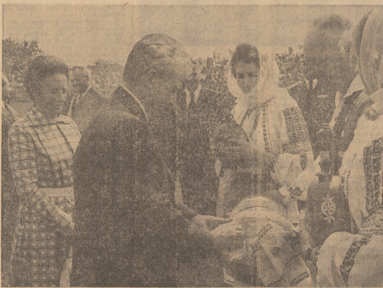
Tovarășul Nicolae Ceaușescu și tovarășa Elena Ceaușescu sînt întâmpinați, după tradiție, cu pine și sare

Tovarășul Nicolae Ceaușescu, secretar general al Partidului Comunist Român, președintele Republicii Socialiste România, a făcut vineri, împreună cu tovarășa Elena Ceaușescu, o vizită de lucru în județul Tulcea.