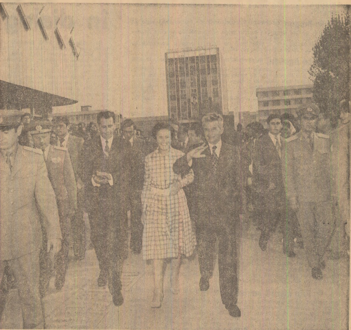
Pretutindeni — ambianță însuflețită, satisfacția maselor, optimismul perspectivelor