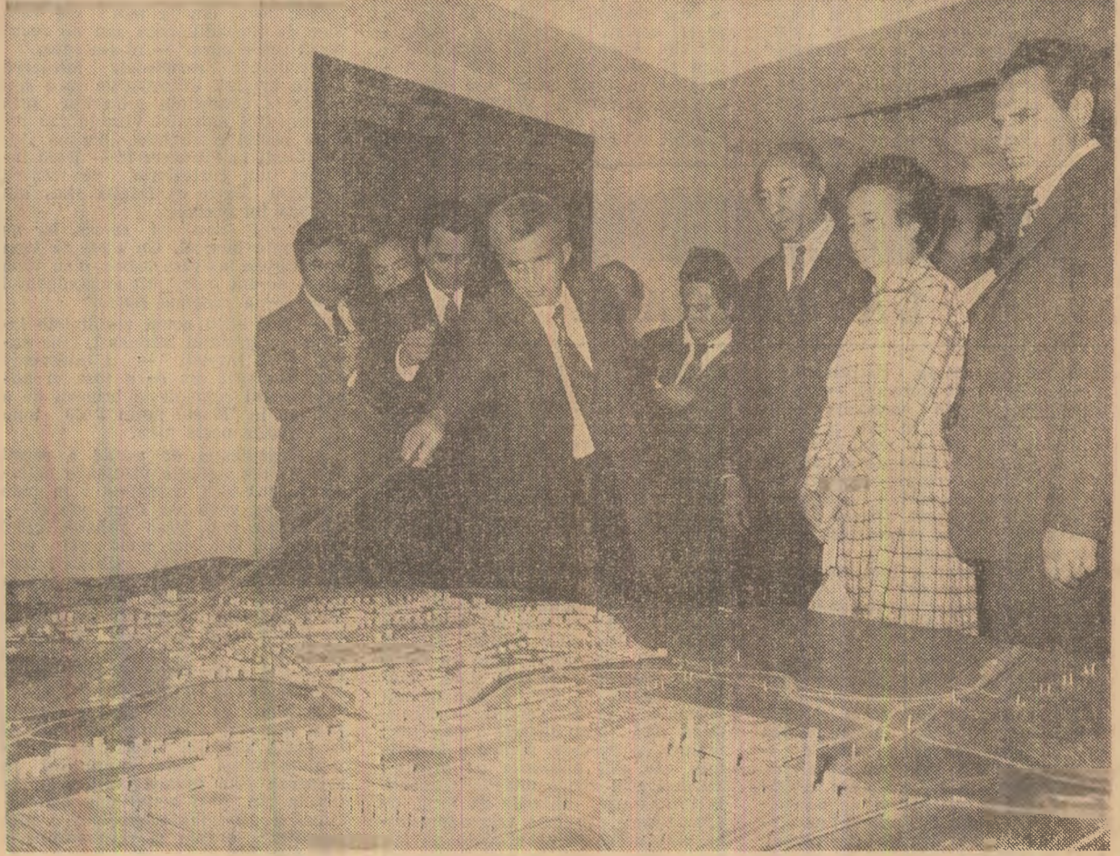
În fața machetei viitoarei dezvoltări a municipiului Tulcea

Tovarășul Nicolae Ceaușescu a recomandat să se găsească soluții care să asigure iluminarea naturală a magazinului și la etajele uru și doi. Apreciind diversitatea de bunuri aflate în rafturile și galeatarele magazinului, tovarășul Nicolae Ceaușescu a cerut amănunțit asupra contribuției județului la aprovizionarea acestui magazin, subliniind, în context, necesitatea de a se asigura continuarea tradițiilor artizanale tulcene și valorificarea acestora în rețeaua comercială. „Este bine — a spus secretarul general al partidului — să aduceți mărfuri din toată țara. Dar este necesar să asigurați și prin comerț specificul județului”.