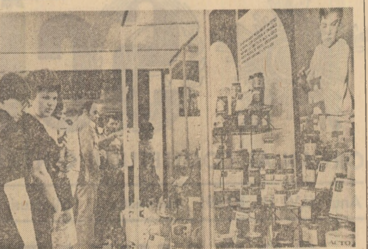
TÎRGUL DE MOSTRE DE BUNURI DE CONSUM

Ne-am oprit pentru început la Craiova. Seful restaurantului „Dacia” n-a putut decît după multă trudă, și cu mare aproximare, să ne arate ce fel de mîrfuri intră, în 24 de ore, în localul pe care îl conduce. — Ne-a putut — un fel de a spune — pentru că de fapt știa acest lucru foarte bine. Astfel, la întrebară „Ce profil are localul?” — responsabilul ne-a dat să înțelegem că „Dacia” e un restaurant, frumos! La altă întrebare — care e specialitatea casei? — ne-a vorbit despre „grătar”. În ce privește aprovizionarea, iată ce se vinde zilnic la „Dacia”: aproximativ 80 kg carne și preparate din carne și cam 20 kg de legume crude (și alte 10 kg semiconserve de legume). Prin urmare, planul de măsuri al M.C.I. — prelucrat în întreprindere (cu mult timp în urmă) — nu este aplicat tocmai în punctele lui esențiale. De ce? Pur și simplu pentru că seful localului nici măcar nu și-a pus serios problema să-l aplice! A citit instrucțiunile a zis „Da, am înțeles” și în loc să comande la masă de mîrfuri, pe lină carne și pui, două legume, brînzeturii, lapte proaspăt ș.a.m.d., pentru a echilibra oferta și diversifica produsele, a comandat tot 80 kg de carne și a încins bine grătarul și țigările cu sosuri grase. Simplu, ușor, fără bătaie de cap. De ce nu are și alt fel de preparate? Nu e vorba de nici o cauză obiectivă. În