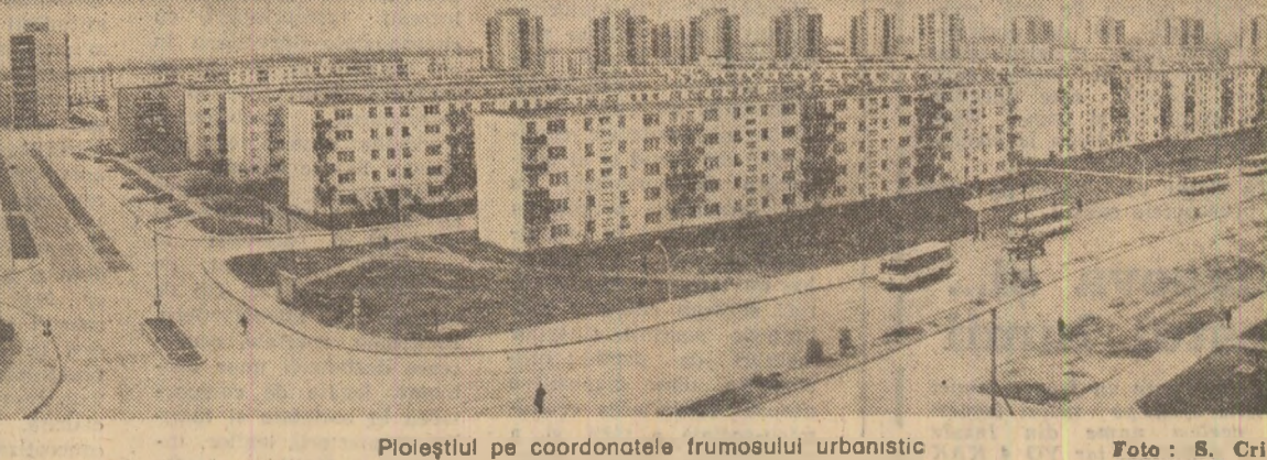
Ploieștiul pe coordonatele frumosei urbanistice

Mulțumind, tovarășul Nicolae Ceaușescu a arătat că publicarea acestui volum în Israel contribuie la mai bună cunoaștere a României, a politicii sale interne și externe, la dezvoltarea relațiilor dintre cele două popoare. În continuare a avut loc o conversație, care s-a desfășurat într-o atmosferă cordială.