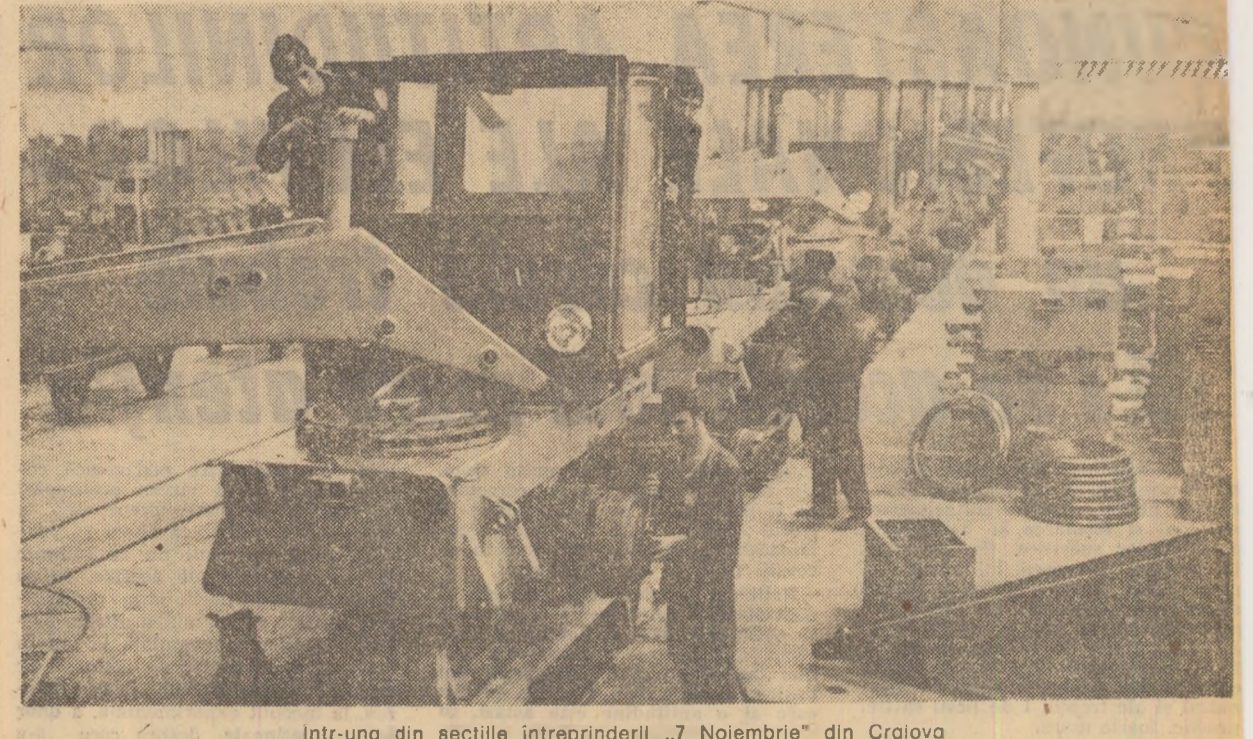
Într-una din secțiile întreprinderii „7 Noiembrie” din Craiova