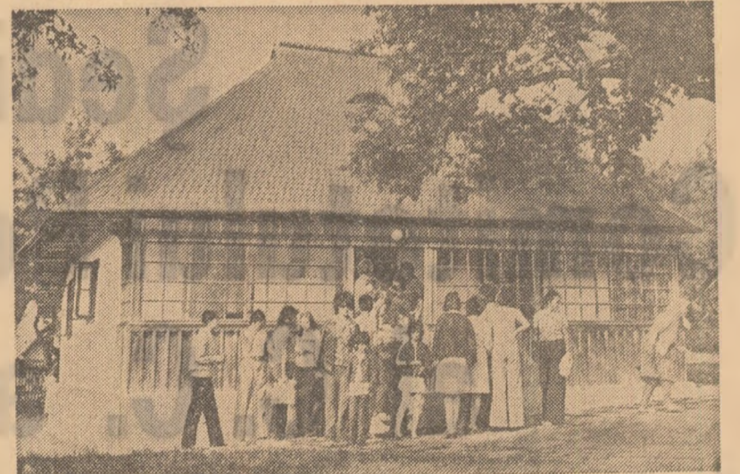
O invitație pentru turșii care trec prin județul Suceava: casa memorioară „Ciprian Porumbescu” din comuna cu același nume