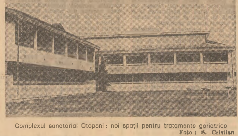
Complex sanatorial Otopeni: noi spații pentru tratamente geriatrice