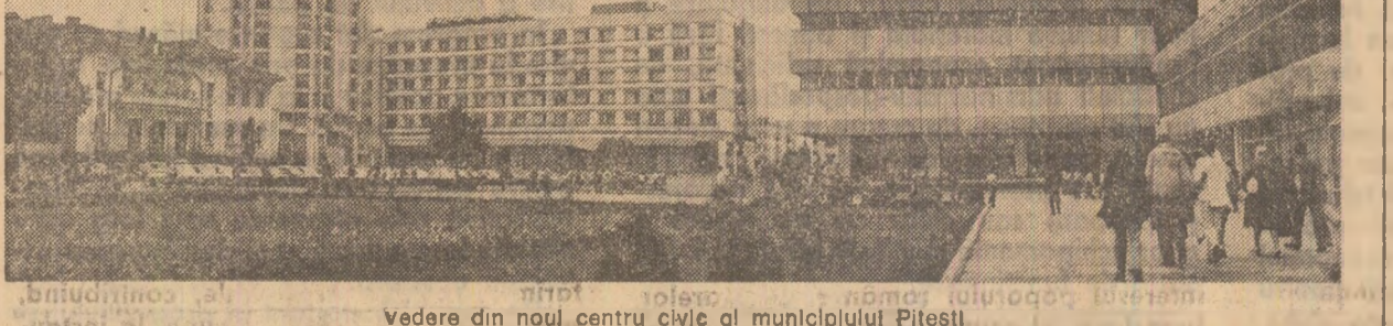
Vedere din nou, centru civic al municipiului Pitești.

Președintele comiteii municipale de protecție a mediului din cadrul