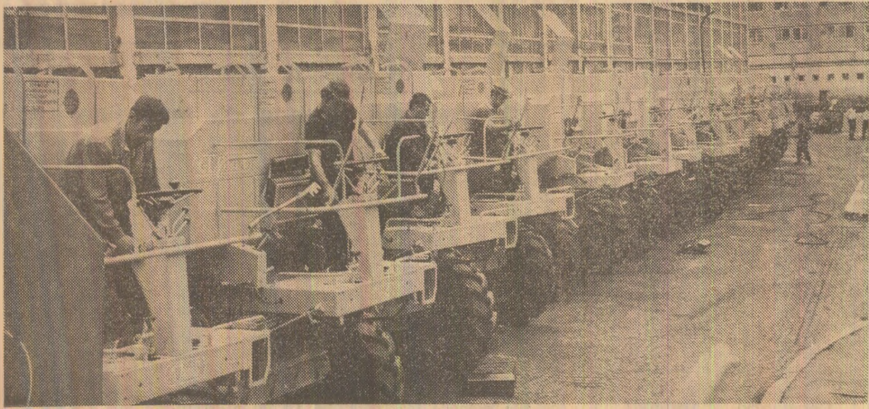
Întreprinderea „Semănătoarea”-București : un nou lot de combine este pregătît, pentru livrare

Viața de partid ; Din poșta redacției : fapte, opinii, propuneri ; În spiritul Legii sistematizării ; „Știința” pe urmele „Științei” ; Faptul divers ; Carnet plastic ; Sport ; De pretutindeni.