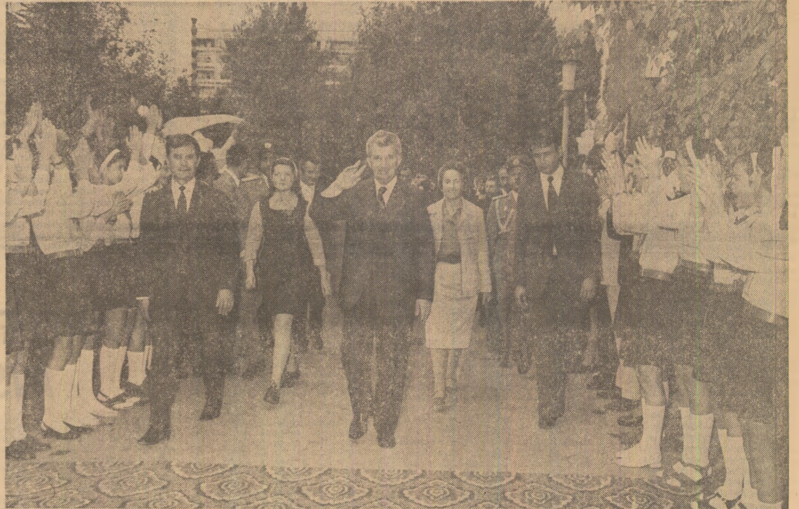
Primire plină de căldură la Grupul școlar al Ministerului Industriei Ușoare