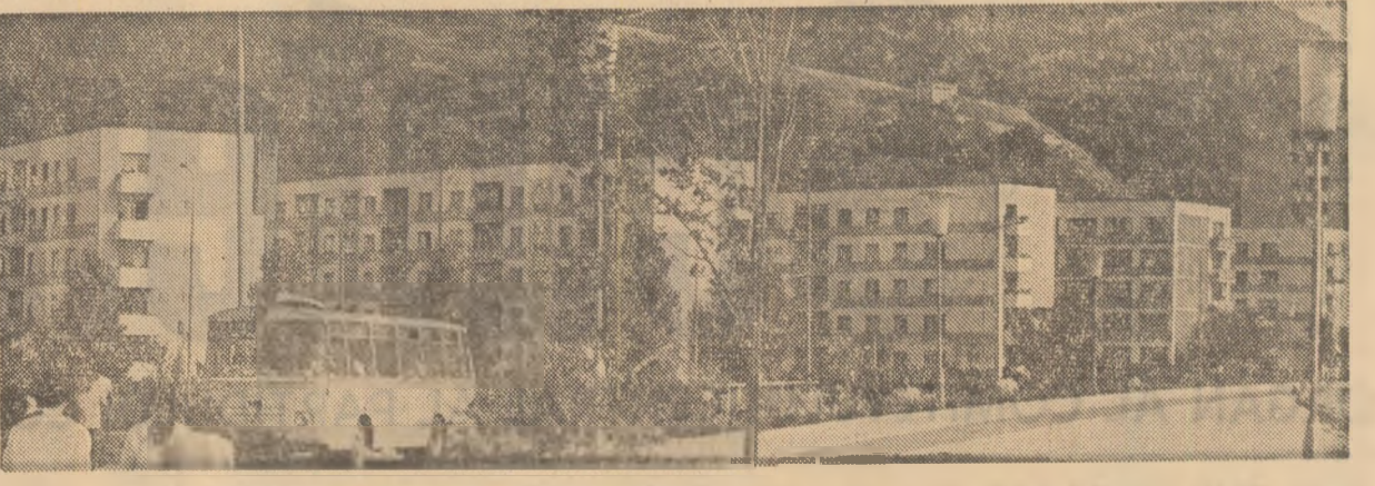
Imagine din Orșova de azi

combinetele și organizîndu-se tăiatul manual al capitelor acolo unde s-a constatat o cere, astfel încît această lucrare să se încheie în 4-5 zile. Din această săptămîină a început și recoltarea porumbului. Munca trebuie organizată în așa fel încît oamenii și mijloacele mecanice să acționeze grupat, pe o singură parcelă. Esențial este, pe o sîngură recoltată să fie transportată și depozitată în aceeași zi, iar terenul să se elibereze de coceni spre a putea fi pregătit în vederea înfrîmîntărilor. Deoarece stadiul