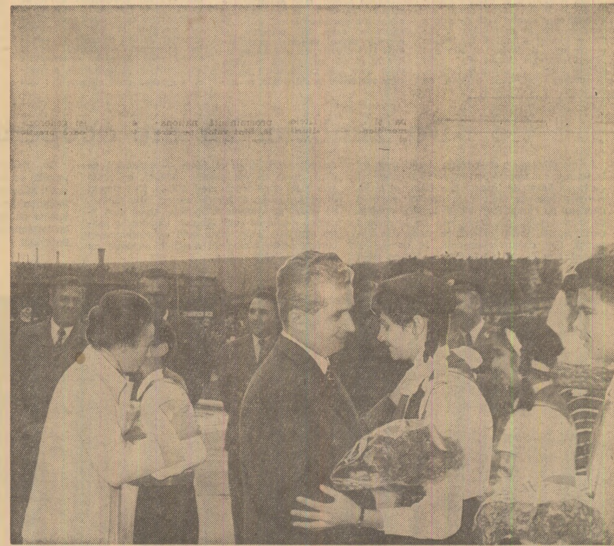
Pretutindeni, calde manifestări de dragoste și înalt respect