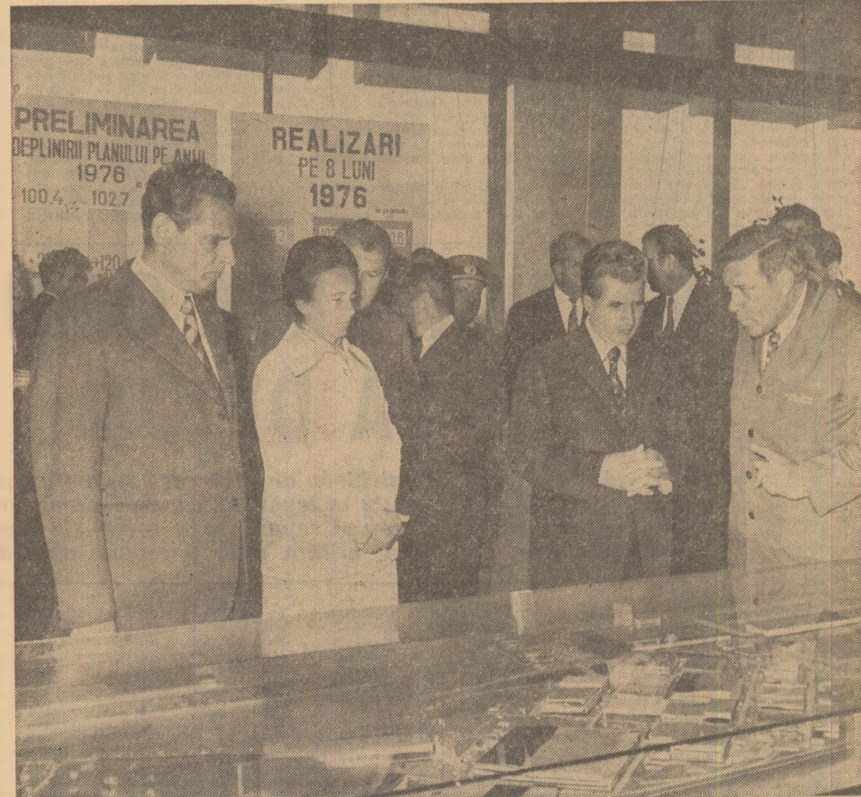
Se analizează probleme ale dezvoltării întreprinderii de autoturisme

Tovarășul Nicolae Ceaușescu s-a referit apoi la întreprinderea de componente electronice, aflată în imediata apropiere a unității vizitate, care produce, între altele, condensatoare și rezistențe, cerînd factorilor de resort să accelereze realizarea programului de punere în fabricație a noulor tipuri de piese.