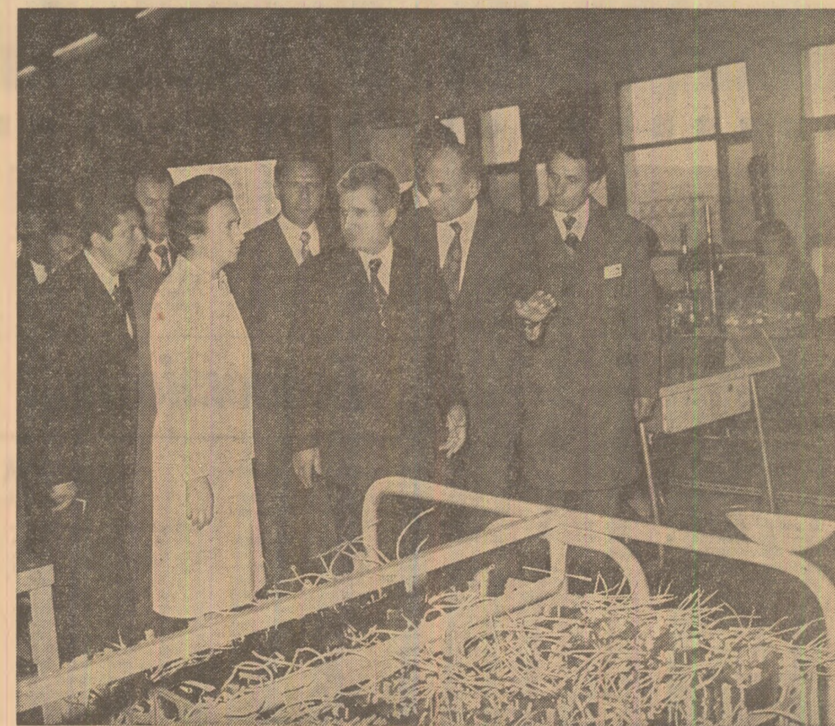
La întreprinderea „Electroargeș”