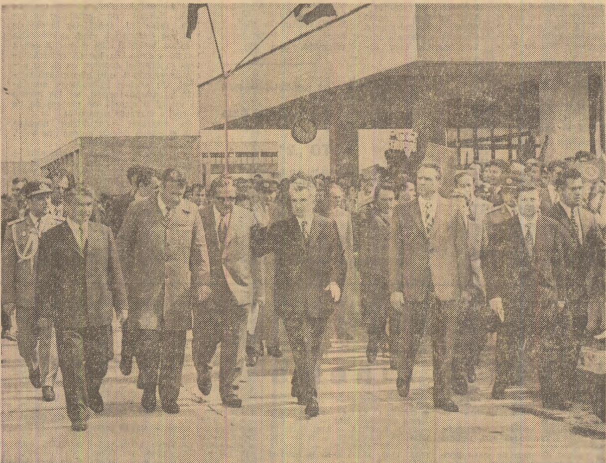
În timpul vizitei la întreprinderea de autoturisme