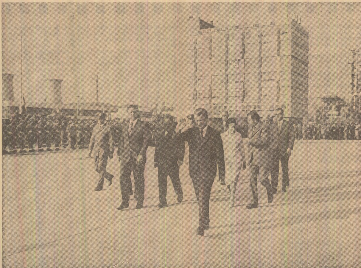
Pe platforma Combinatul chimic din Rîmniceu-Vîlcea

În context, tovarășul Nicolae Ceaușescu recomandă o sporire a preocupărilor pentru punerea în funcțiune a tuturor acestor obiective la termenele planificate, discuția relevînd, totodată, existența unor importante rezerve care pot și trebuie să accelereze ritmul edificării economice din județ. La plecare, pe platforma marelui Combinat chimic din Rîmniceu-Vîlcea are loc o emoționantă demonstrație a atașamentului oamenilor muncii față de partid, față de secretarul său general — expresie elocventă a hotărîrii de a traduce în viață sarcinile mobilizatoare ce le revin în acest cincinal.