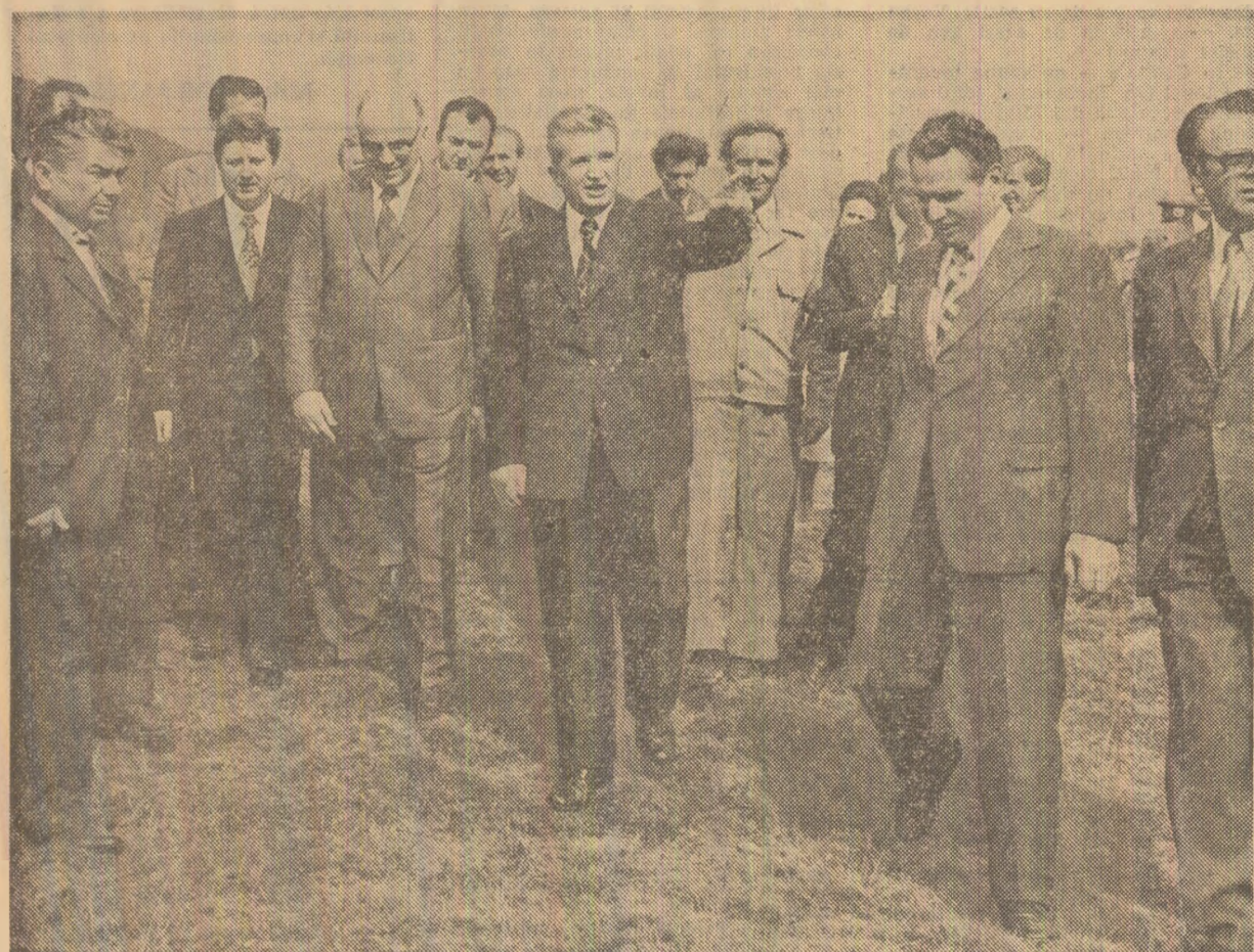
Pe șantierul viitoarelor uzine de fire și fibre chimice din Cîmpulung