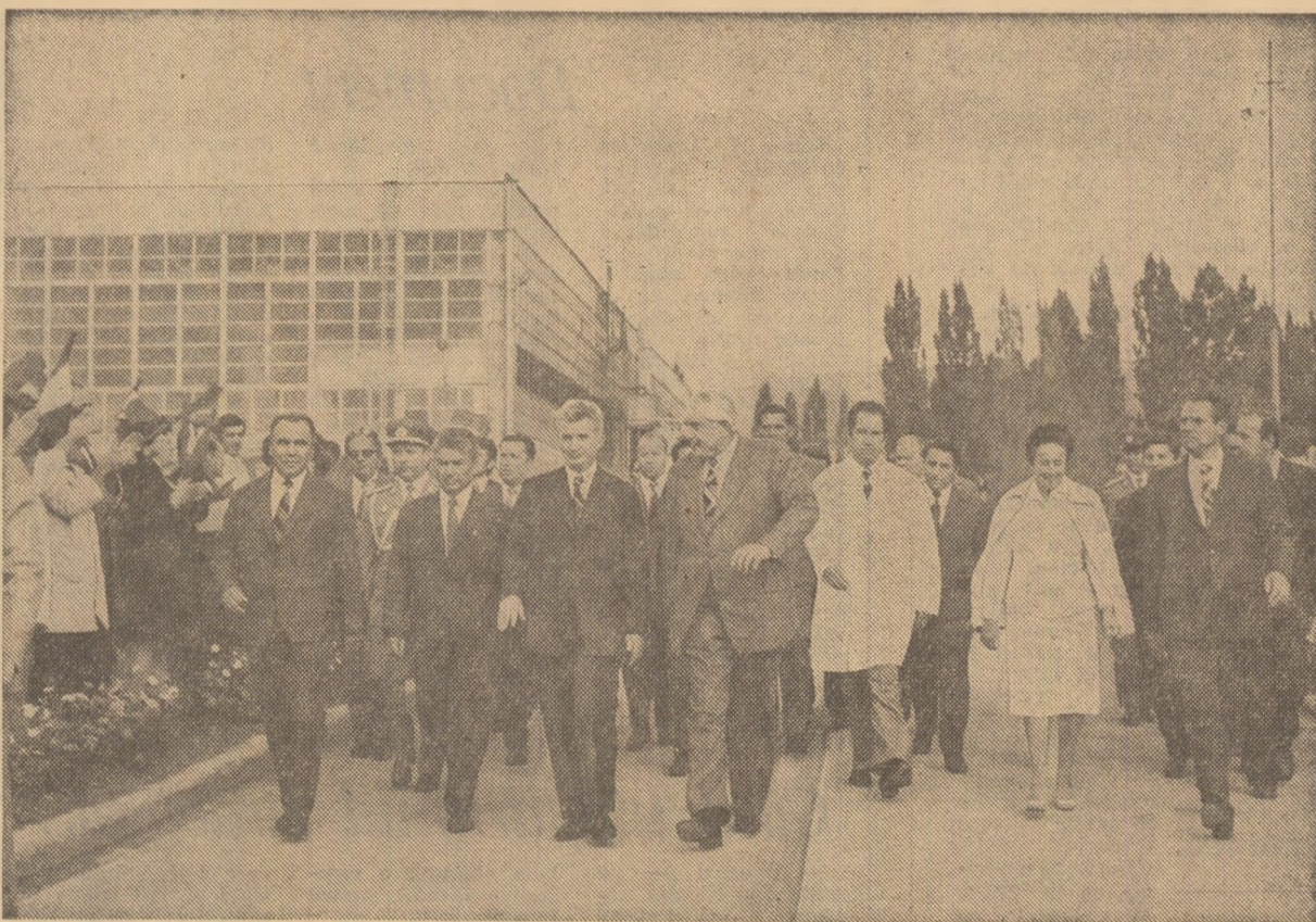
Imagine din timpul vizitei la întreprinderea mecanică Muscel

Secretarul general al partidului și sînt prezentate apoi o serie de preocupări actuale ale colectivului. În acest cadru s-a subliniat că au fost luate de pe acum măsuri pentru depășirea indicatorilor economici pe baza creșterii productivității muncii, dat fiind că la recentul Tîrg de mostre de bunuri de consum de la București a fost contractată întreaga producție a anului viitor, solicitîndu-se cantități suplimentare. Remarcînd cu plăcere rezultatele bune ale muncii acestui colectiv, alcătuit în cea mai mare parte din tinere muncitoare, a căror vîrstă medie este de 22 de ani, tovarășul Nicolae Ceaușescu a recomandat creatorilor să se inspire mai mult din tradițiile folclorului argheșean, ale artii populare românești, să realizeze adevărate opere de artă. Tovarășul Nicolae Ceaușescu a apreciat faptul că tot el care lucrează în unitate, de la muncitor pînă la inginer, de-