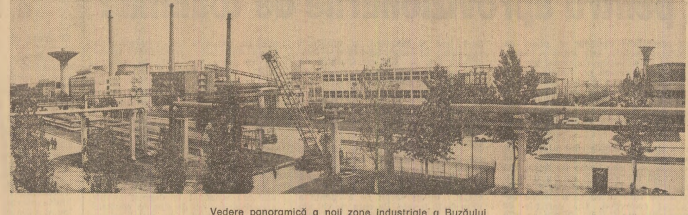
Vedere panoramică a noii zone industriale a Buzăului