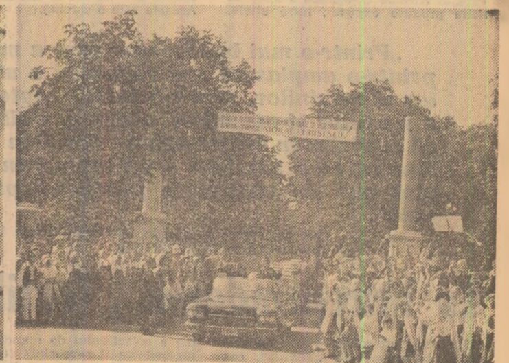
Imagini semnificative din timpul vizitei în municipiul multiseclar Buzău, în întreprinderi din zona sa industrială