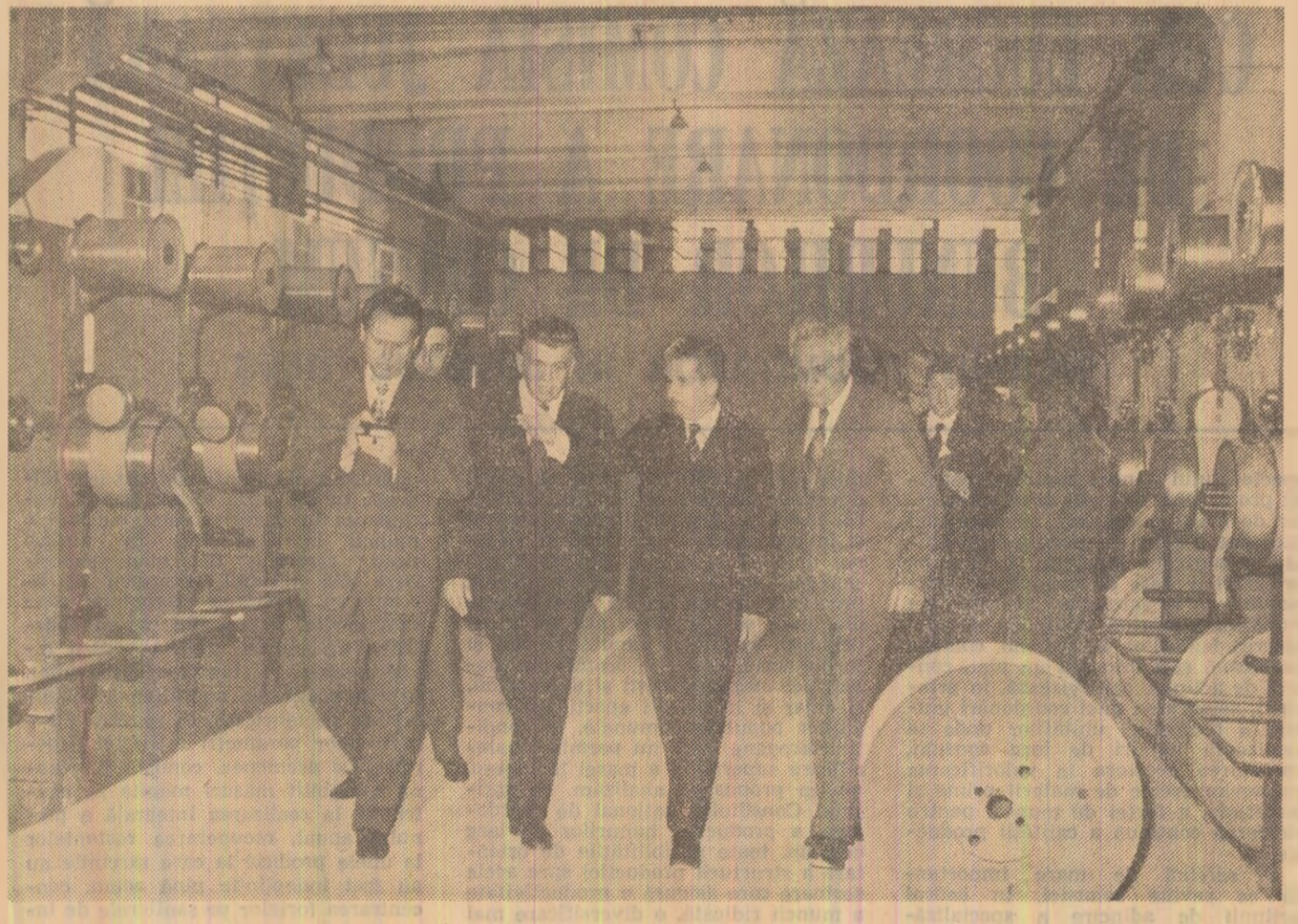
La întreprinderea de sîrmă și produse din sîrmă, se analizează problemele folosirii eficiente a spațiilor de producție

Urez tuturor locuitorilor municipiului și județului Buzău noi și însemnate succese în dezvoltarea economică, socială și edilitar-gospodărească pentru aplicarea în viață a hotărîrilor Congresului al XI-lea al Programului Partidului Comunist Român, pentru ridicarea națiunii noastre pe trepte tot mai înalte de bunăstare, civilizație și progres.”