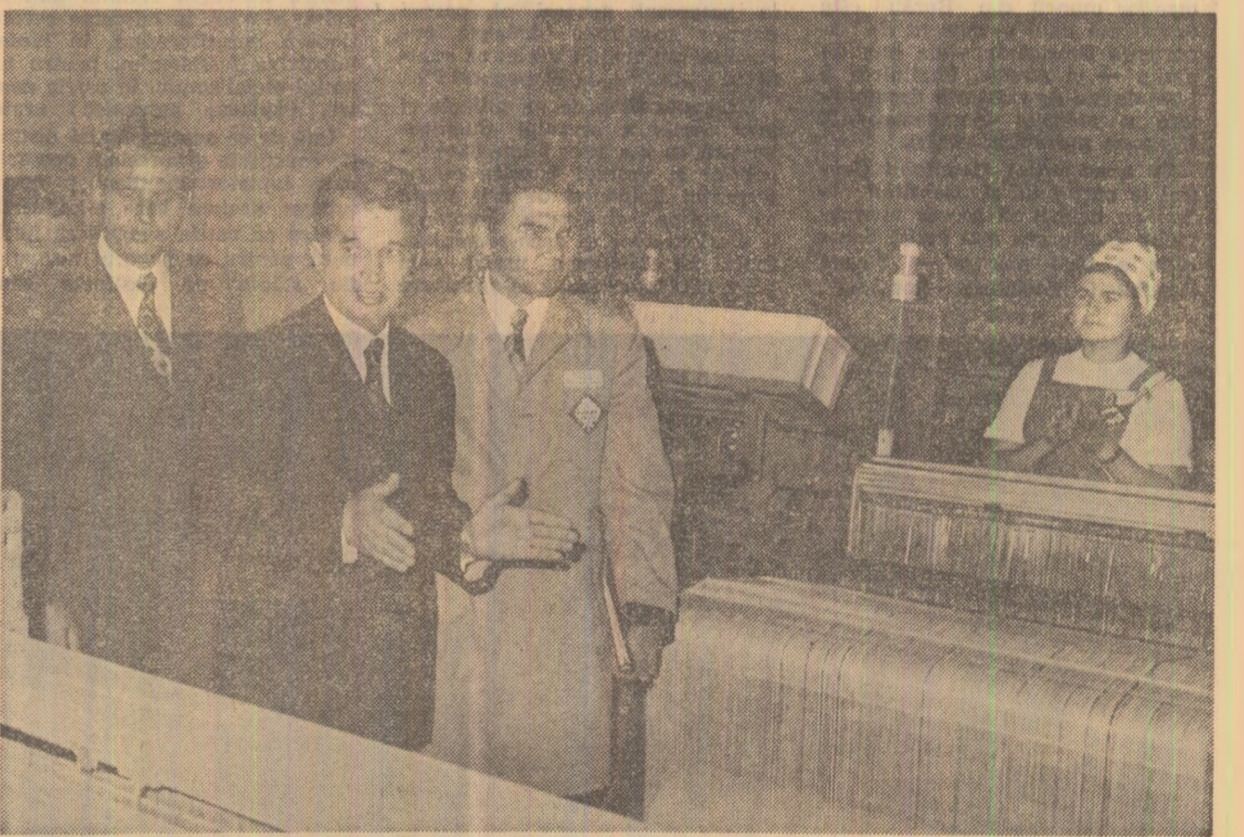
Modernizarea proceselor de producție — una din temele analizei întreprinderea „Textila“