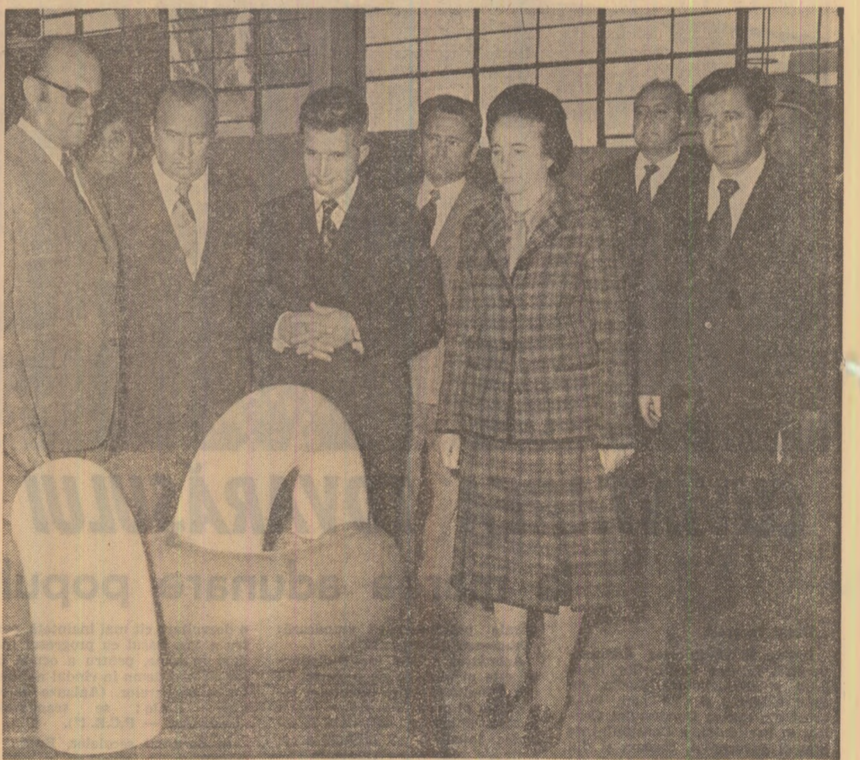
Întreprinderea de utilaj tehnologic: se discută probleme concrete ale eficienței economice