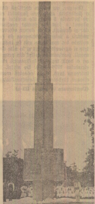
Obeliscul consacrat momentului jubilar — aniversarea a 16 veacuri de la prima mențiune documentară a Buzăului