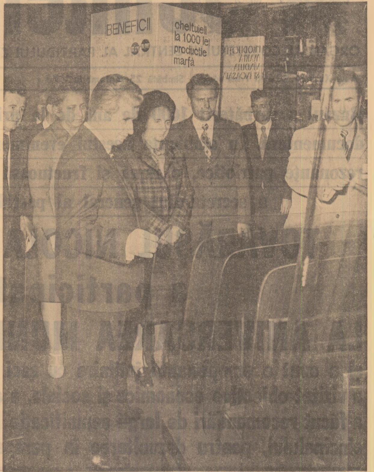
La fabrica de geamuri, un obiectiv prioritar: în spațiile actuale, o producție dublă în acest cîncinal

În această atmosferă, tovarășul Nicolae Ceaușescu și tovarășa Elena Ceaușescu se îndreaptă, împreună cu ceilalți tovarășii din conducerea de partid și de stat, spre marea adunare populară care încununează această sărbătoare.