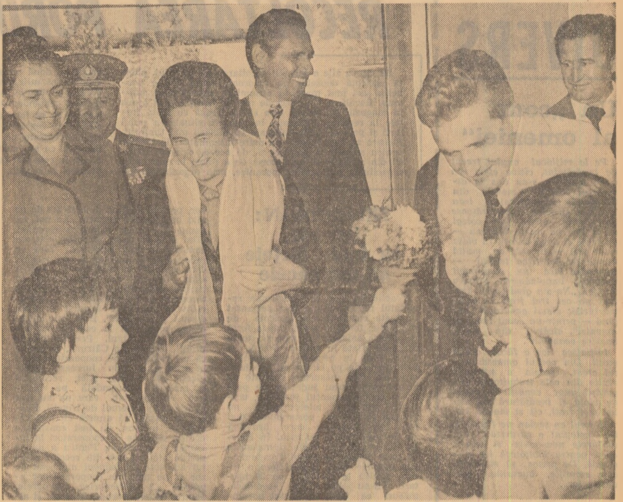
La „Textila”, copiii muncitoarelor întîmpină cu dragoste pe înalții oaspeți

Dorim să exprimăm și cu acest prilej adevărată mulțumire și apreciere activității neobosite, plină de patos revoluționară, pe care dumeavoastră, mult stimată tovarășe secretar general, o desfășurați în fruntea partidului și statului, modulul strălucit în care călăuziți destinele poporului român, pentru ca țara noastră să ocupe un loc tot mai demn în rîndul popoarelor lumii. În numele comunistilor, al tuturor cetățenilor de pe aceste me-