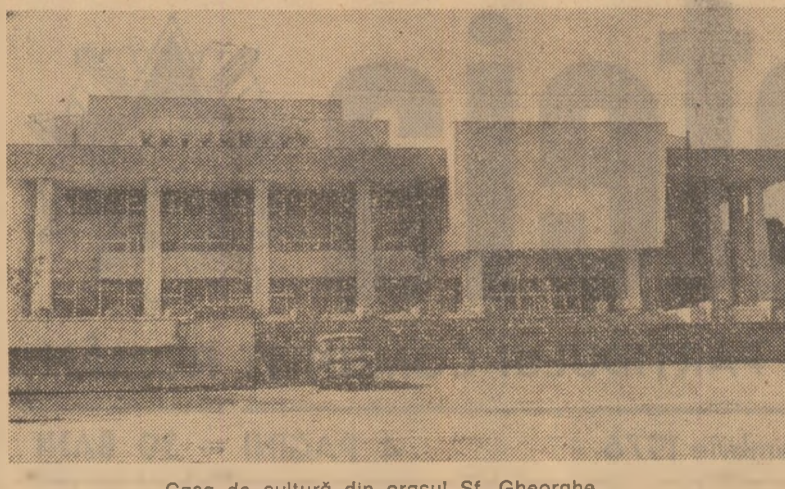
Casa de cultură din orașul Sf. Gheorghe.

PROGRAMUL II 17.00 Telex. 17.05 Cîntec și jocuri populare. 19.30 Marelui și micului ecran în pas cu viața. 19.30 Cîntec pentru prieten. 19.30 100 de seri. 19.30 Telex. 20.00 Film serial pentru copii. 20.25 Din noi despre preferințele dv. 21.15 Telex. 21.20 Pe teme economice. 21.45 Telex.