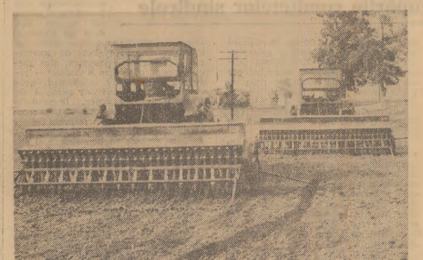
Semănatul grului la C.A.P. Osica de Sus, județul Olt.

Oamenii muncii din agricultură, toți locuitorii satelor sînt chemați ca în această perioadă de vîrf să muncească cu dăruire și responsabilitate pentru a strînge la timp și fără pierderi roadele acestuia an, pentru a pregăti temeinic recolta viitoare.