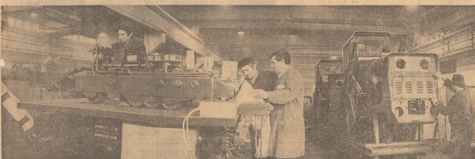
În secția de montaj a întreprinderii de utilaje și piese de schimb din Miercurea Ciuc

Preocupările pentru aprovizionarea de toamnă-iarnă cuprind însă nu numai sectorul alimentară. Sînt stabilite măsuri pentru o mai bună satisfacere a cerințelor de consum ale populației și cu textile, încălțăminte, combustibil și articole metalo-chimice specifice sezonului rece. Fondul de marfă asigurat prin contracte va fi mai mare față de anul trecut atât la confectii, textile, cit și la încălțăminte, produsele realizate în acest sector urmînd să fie oferite cumpărătorilor într-o gamă sortimentală mult diversificată. De o atenție aparte se va bucura grupa articolelor destinate copiilor și înetetului, din care se vor livra importante cantități de mărfuri în plus față de anul trecut.