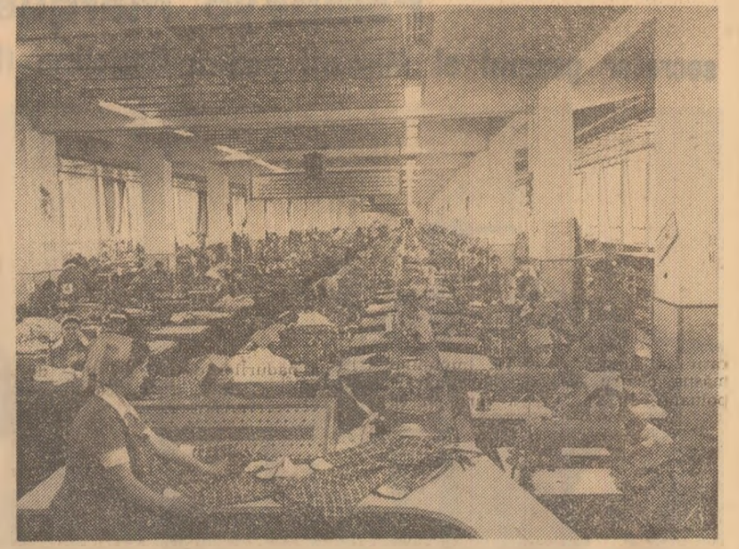
Imagine dintr-o secție a Întreprinderii de confecții din Foșani