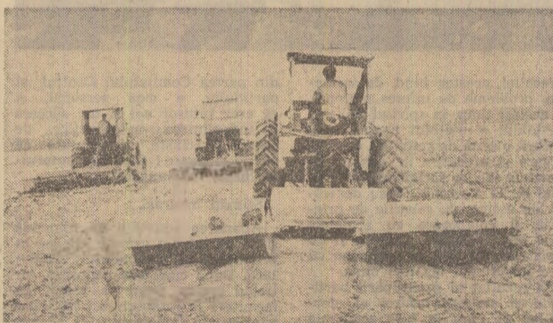
La C.A.P. Pogonaea, județul Buzău, se pregătește terenul pentru