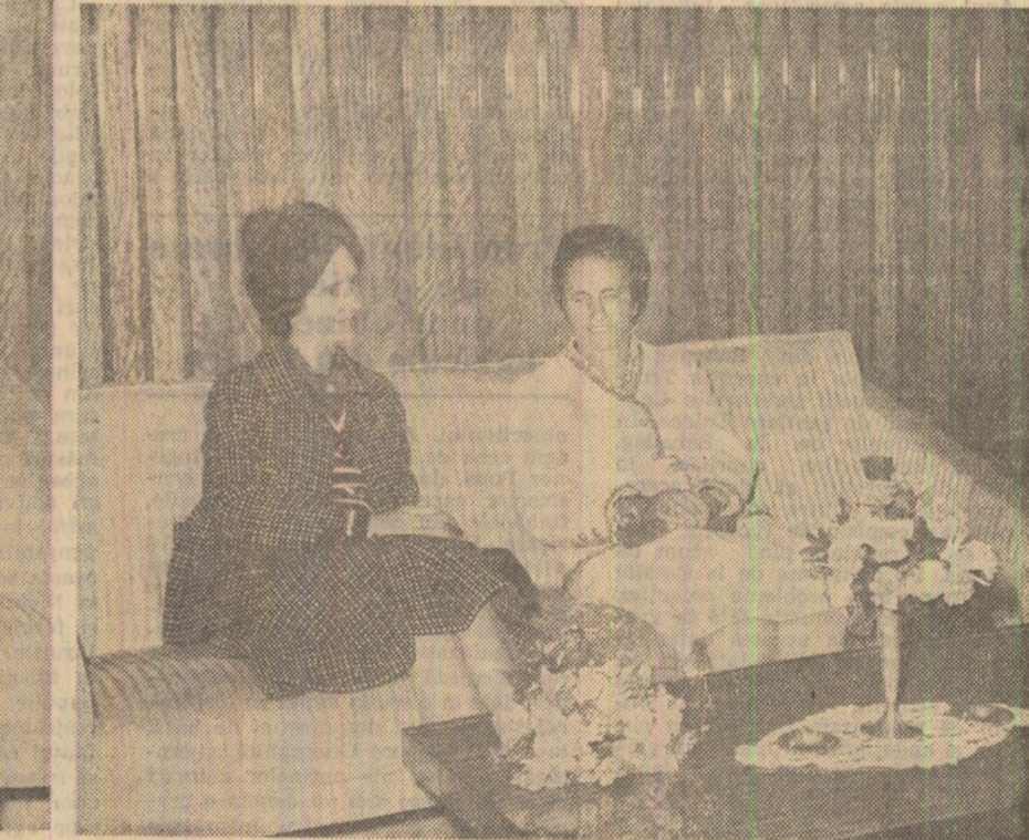
La sosirea pe aeroport și la reședința rezervată suveranilor belgieni