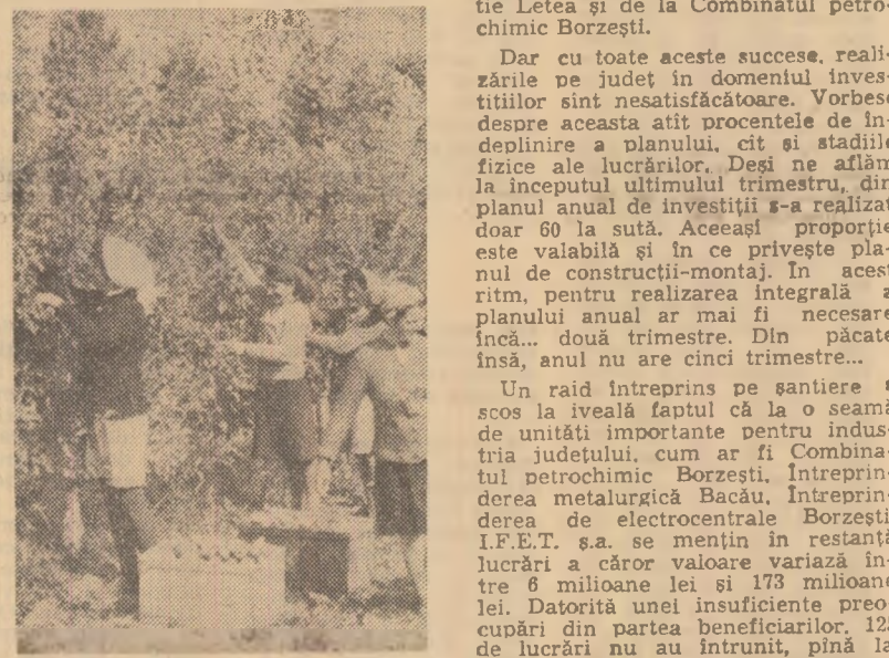
Culesul merelor la Zărnești

Pentru a grăbi coacerea porumbului, în cooperativele agricole din raza S.M.A. Cuza Vodă, unde boabele au umiditate prea mare, a fost luată măsura să se facă depănarea și uscarea lor în lan. Porumbul poate fi recoltat mai devreme și depozitat în bune condiții. Folosirea combinelor C-3 cu o adaptare foarte simplă la tăierea coccenilor este o altă inițiativă, care va rezolva eliberarea grabnică a terenului de resturi vegetale și va asigura, totodată, sporirea cantităților de furaj insulozate. Demonstrația a fost făcută la S.M.A. Slobozia, după care a fost preluată de toate secțiile de mecanizare. S.M.A. Andrășești a pregătit în acest scop 5 combine, care la o trecere taie cite 5 rînduri față de numai două rînduri