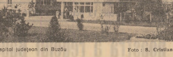
Modernul spital județean din Buzău