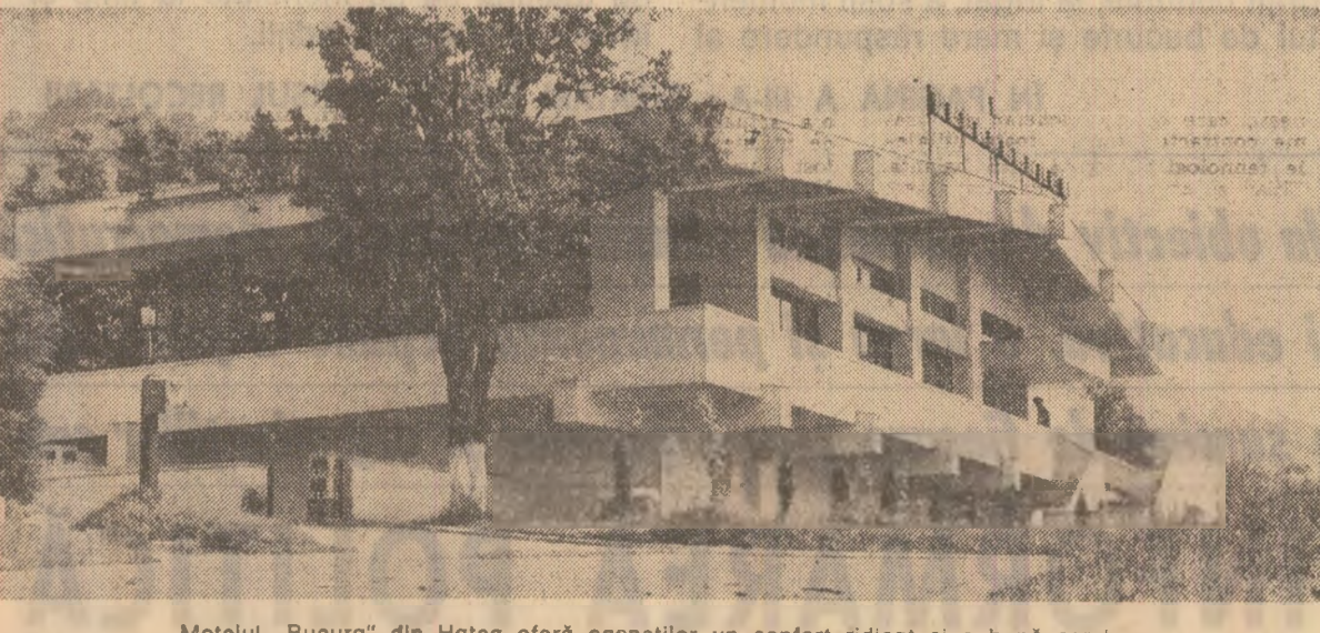
Motelul „Bucura” din Hateg ofera ospaților un confort ridicat și o bună servire